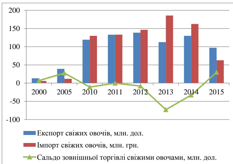
Рис. 1. Експорт-імпорт свіжих овочів у 2005-2015 роках, млн. дол. США

зовнішня торгівля свіжими овочами демонструє, що ми маємо у 2015 році перше позитивне сальдо за останніх 10 років. Так, експорт свіжих овочів у 2015 році склав 97,4 млн. дол. США, а імпорт 62,8 млн. дол. США. Товарна структура експорту-імпорту свіжою овочевою продукцією показує, що за 2000-2015 рр. обсяги експорту зросли у 7,3 рази, а обсяги імпорту – 10,3 рази (рис. 1).