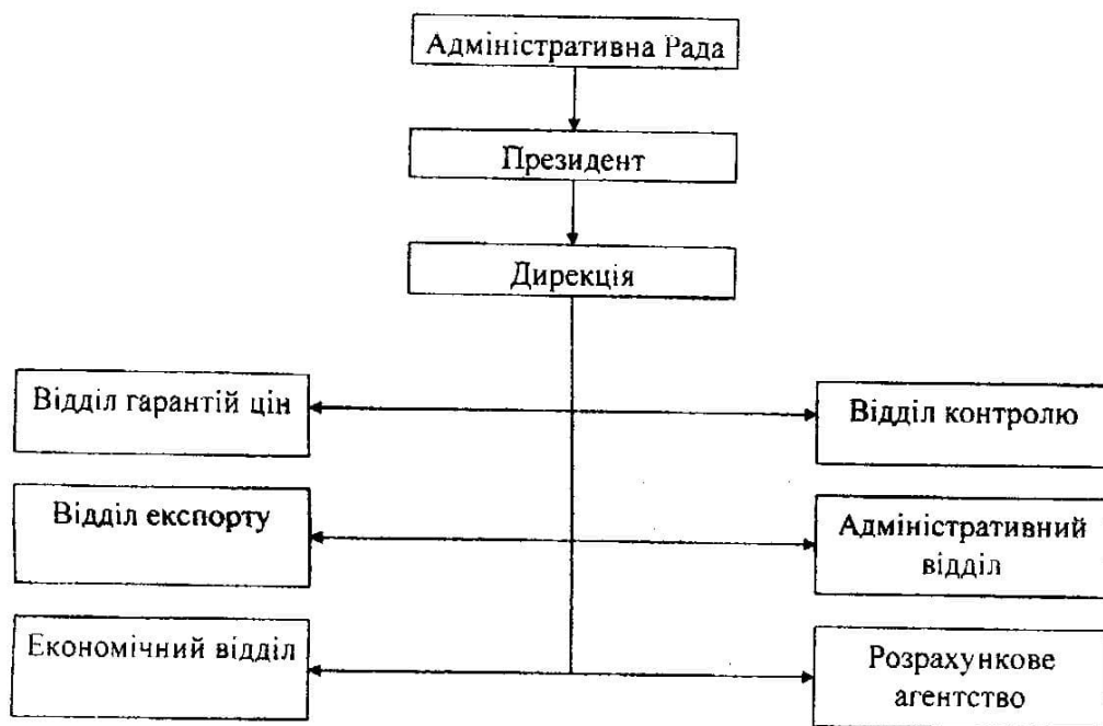
Рис.3. Схема структури державної організації "Фонд регулювання ринку цукру" (з філіалами в областях).