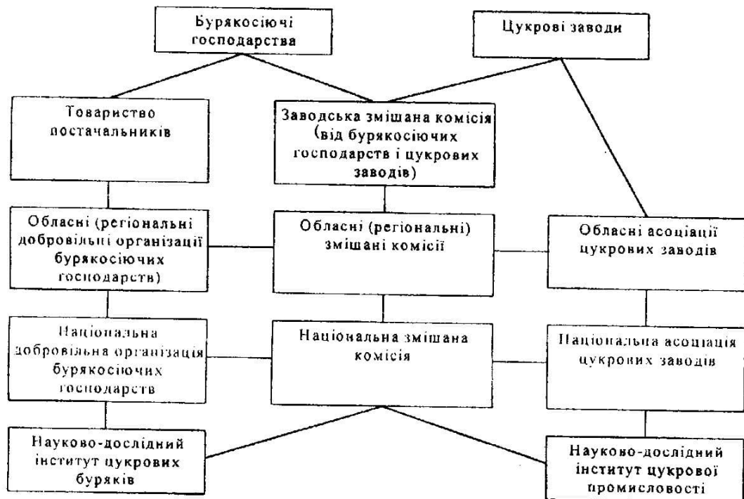
Рис. 2. Міжгалузеві зв'язки в бурякоцукровому виробництві при ринковій моделі управління.

цукровими заводами повинні вирішуватися на основі створення на обласному та республіканському рівнях міжгалузевих змішаних комісій. Ми пропонуємо схему міжгалузевих зв'язків в бурякоцукровому виробництві при ринковій моделі управління (рис.2).