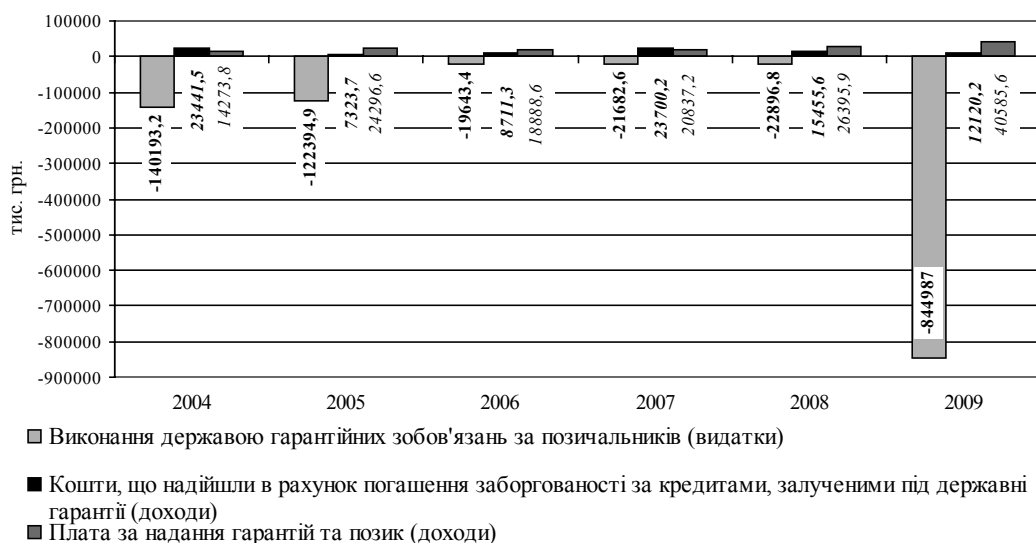
Рис. 3. Доходи та видатки Державного бюджету України за виданими урядом гарантіями [5].

Впродовж 2004–2009 рр. видатки державного бюджету з виконання зобов'язань гаранта, перевищували доходи за статтею надходження в рахунок погашення заборгованості за кредитами, залученими під державні гарантії. Лише в 2007 р. надходження коштів за даною статтею перевищували видатки з виконання обов'язків гаранта (рис. 3). Протягом 2004–2009 рр. питома вага зазначених витрат державного бюджету значно перевищувала їх над-