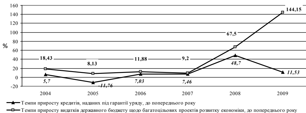
Рис. 1. Темпи приросту кредитів, наданих під гарантії уряду, та видатків Державного бюджету України щодо багатоцільових проектів розвитку економіки [5].

Державні гарантії надаються Кабінетом Міністрів України для фінансування інвестиційних, інноваційних, інфраструктурних та інших проектів розвитку, які мають стратегічне значення та реалізація яких сприятиме розвитку економіки України, в тому числі імпортозамінних і експортоорієнтованих галузей, зокрема [7]: