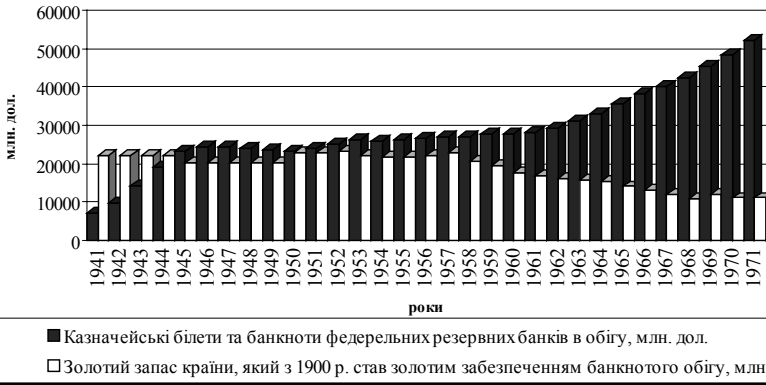
Рис. 2. Динаміка банкотної грошової маси та її золотого забезпечення у Сполучених Штатах Америки, 1870 – 1971 рр.*

* Побудовано автором за даними [2; 3, 7–8; 19, 16–17].