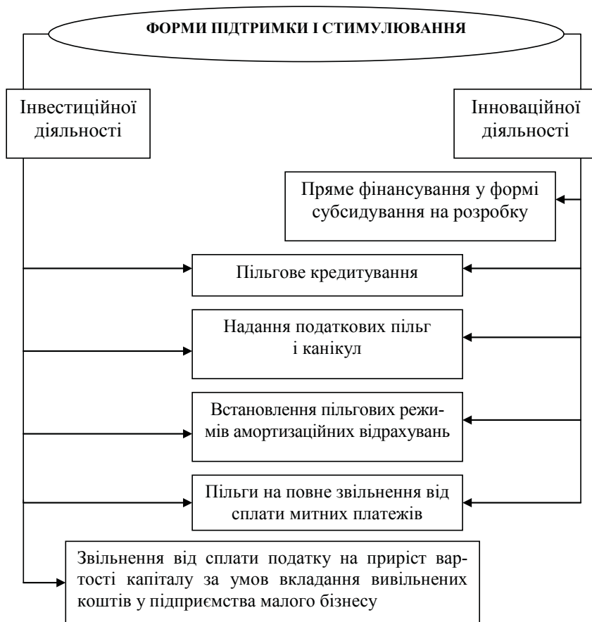
Рис. 2. Основні форми підтримки та стимулювання інвестиційної та інноваційної діяльності

Податкове регулювання в інвестиційно-інноваційній сфері здійснюється через надання податкової знижки на інвестиції та витрати у НДДКР, що дозволяє підприємствам фактично зменшувати прибуток до оподаткування на чітко встановлений відсоток витрат капітального характеру. Іншою найчастіше використовуваною формою пільг є інвестиційний податковий кредит, що передбачає зменшення податкових зобов'язань підприємства з податку