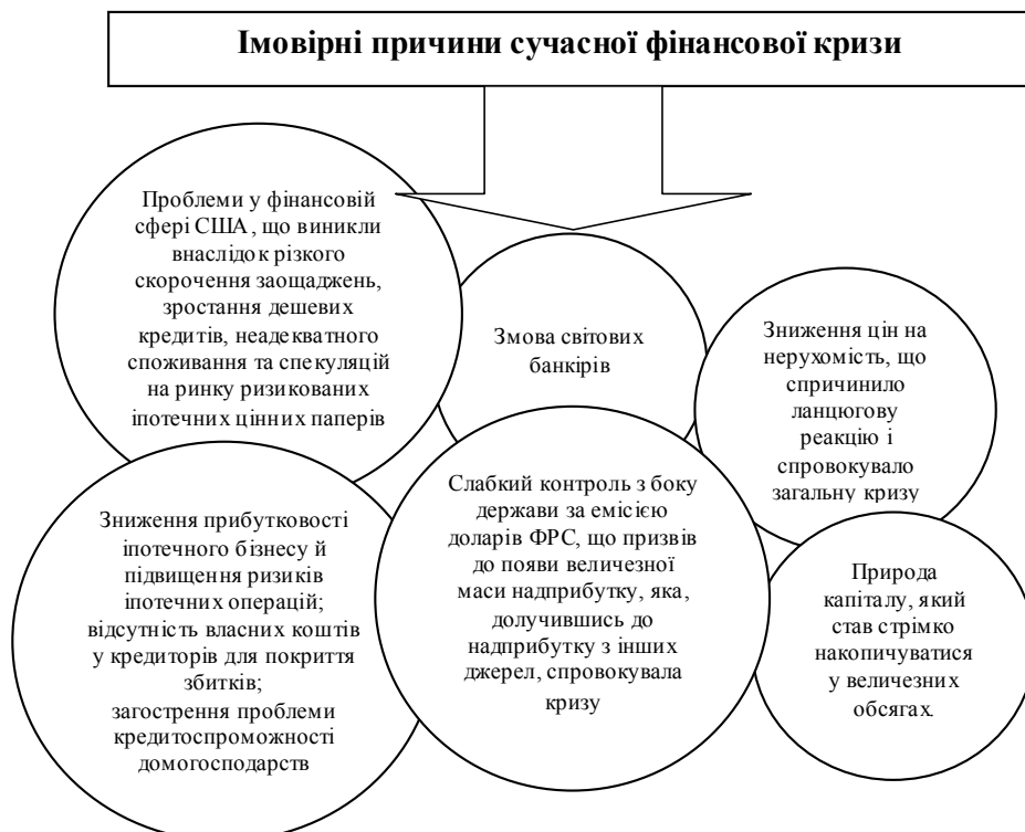
Рис. 2. Імовірні причини сучасної фінансової кризи

Сьогодні міжнародна валютна система не має механізму для запобігання стій-