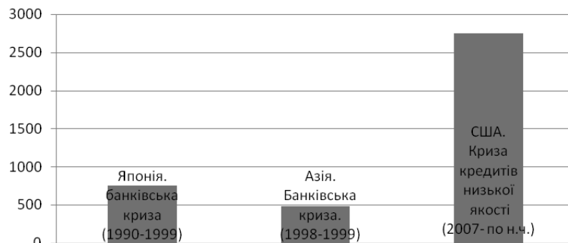
Рис. 3. Втрати від фінансових криз, млрд. дол. США*

Ретроспективний аналіз попередніх криз дає змогу сформулювати основні причини, тенденції, закономірності їх виникнення. Масштабні світові кризи розгорнулися в економічно розвинутих країнах і ланцюговою реакцією зачіпали решту держав світу. Тому можна сформулювати гіпотезу прямопропорційності масштабності кризи та економічної розвине-