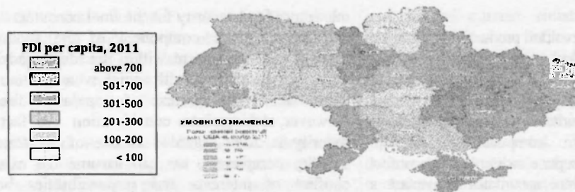
Fig.3. Investițiile străine directe în producerea de alimente în regiunile Ucrainei