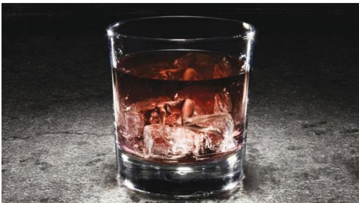
Більше половини потопельників були п'яні