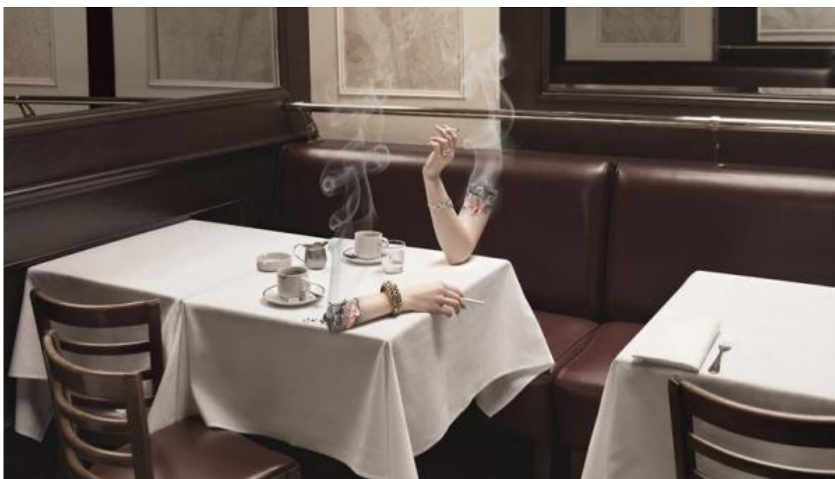
Цигарки теж палять. Не тільки люди