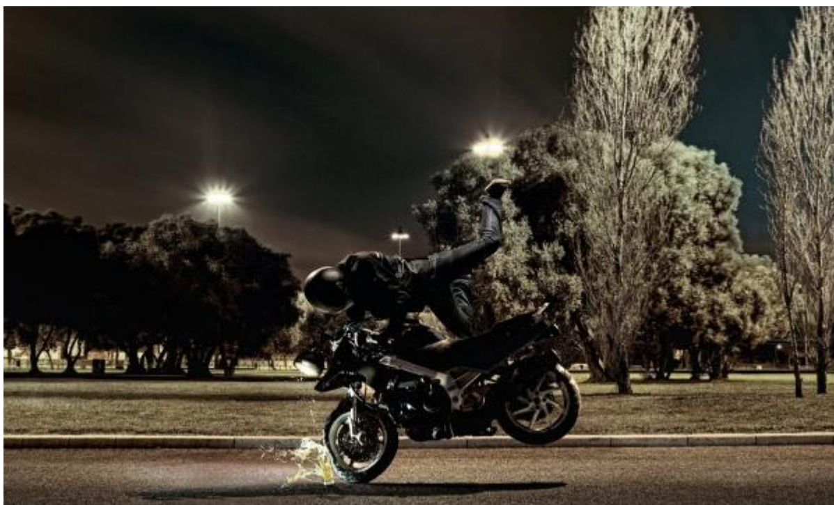
Алкогoль сильніший, ніж ти гадаєш