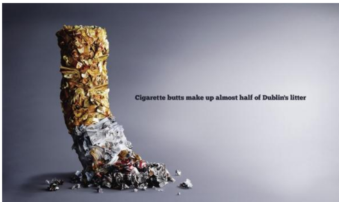
Недопалки становлять половину сміття твого міста