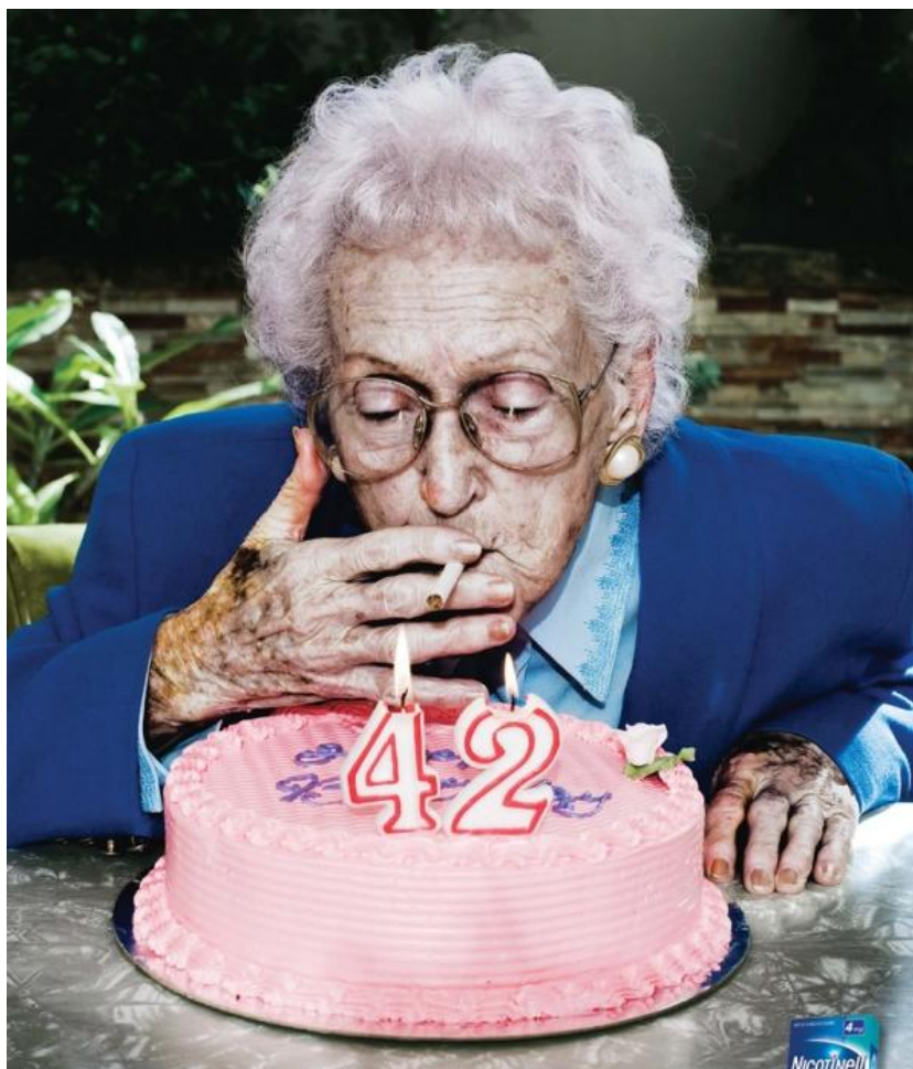
Куріння викликає передчасне старіння