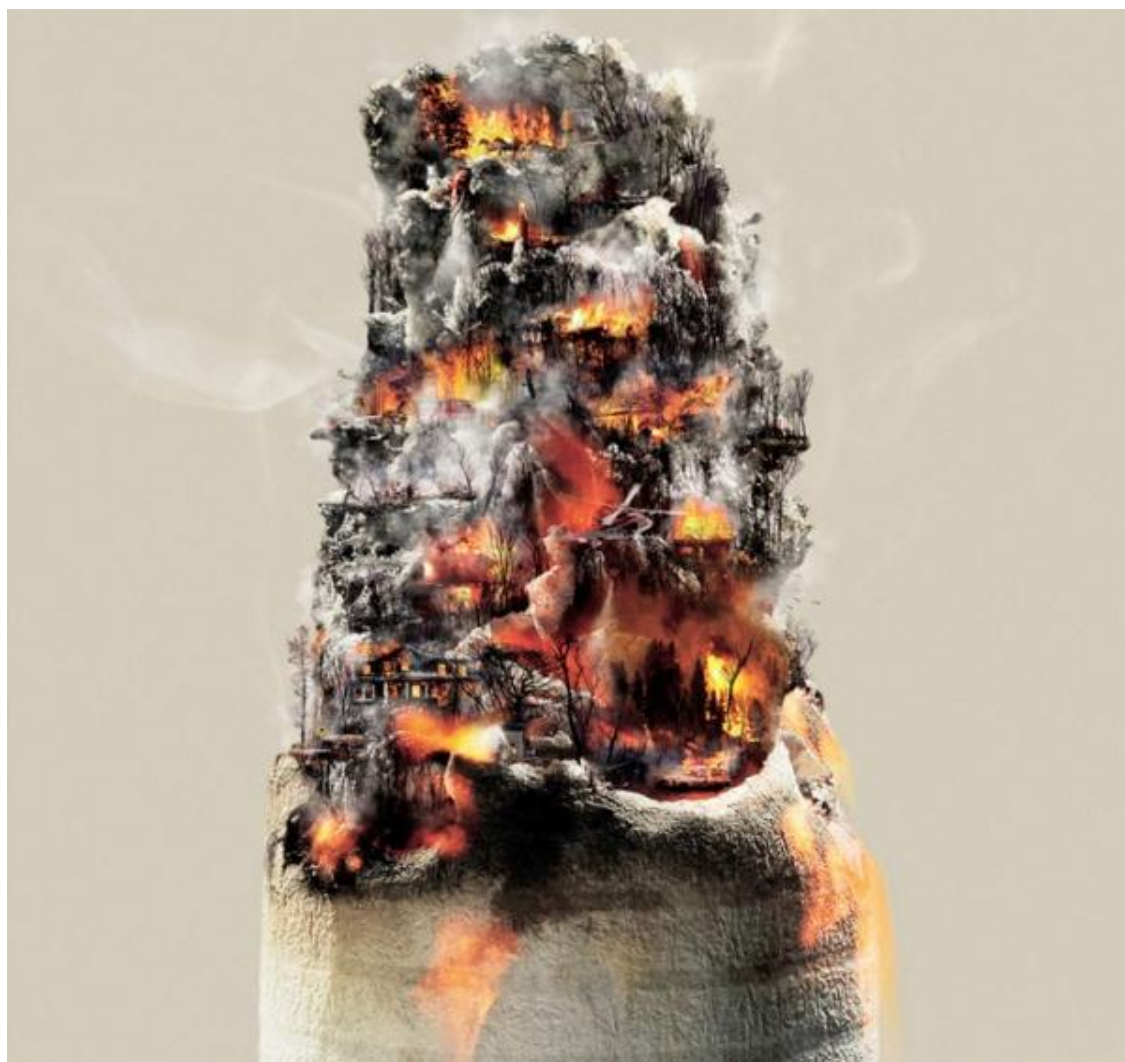
Не пали – спаси себе і природу