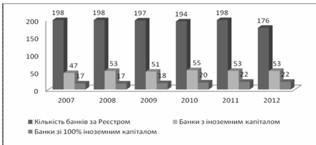
Рис. 2. Динаміка участі іноземного капіталу в банківській системі України [2]

В останні роки роль іноземного капіталу в банківському секторі України зростає. Станом на 01.01.2013 року кількість діючих банків з іноземним капіталом збільшилась до 53, з них 12 банків – зі 100% іноземним капіталом (рис. 2). Причиною входження іноземних банків на інші ринки є пошук не переповнених, менш розвинутих та менш ефективних ринків для того, щоб реалізувати свою конкурентні переваги, такі як: якісніші послуги, менші відсоткові ставки на кредит, досконаліше управління ризиками, більший розмір капіталу.