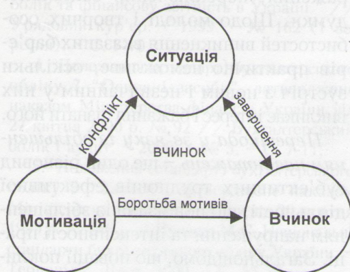
Рис. 2. Схема розвитку вчинку [15]

Будь-яке психічне утворення культурного гатунку є, як відомо, результатом самоактивності людини, яка виявляється через учинок. Цим і пояснюється тенденція наукової психології розглядати найважливіші психічні утворення як такі, що мають вчинкову структуру, тобто містять у собі ситуативний, мотиваційний та дійовий компоненти (рис. 2), або ще й рефлексивний момент як логікозмістове завершення вчинку (рис. 3).