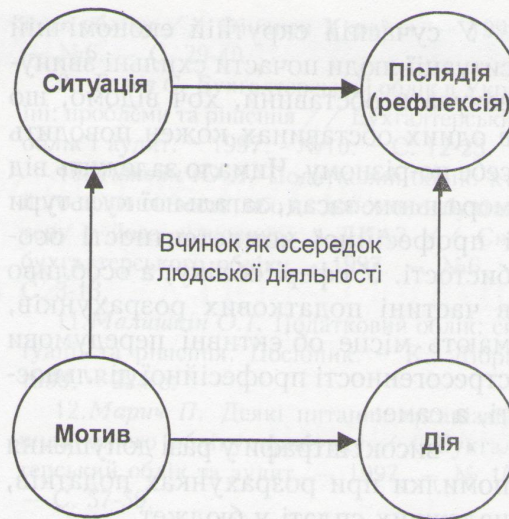
Рис. 3. Структура вчинку (за В.А. Роменцем [17; 19])

Побудова психологічного осередку – вчинку – дає змогу виявити характер психологічних закономірностей професійної діяльності. Формування вчинку свідчить про творче спрямування поведінки особистості.