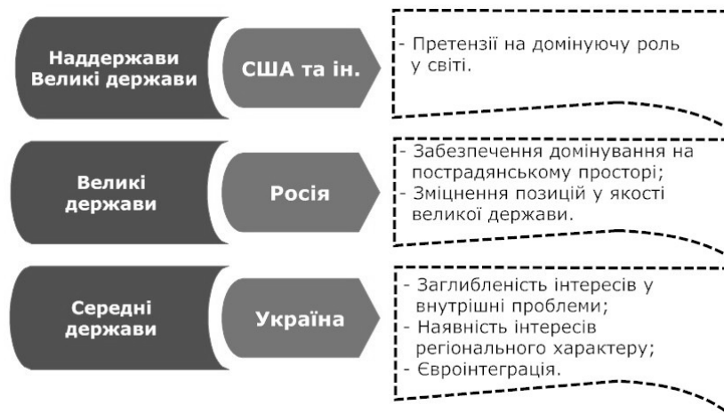
Рис. 2. Інтереси лідерства суб'єктів міжнародних відносин

У науковій літературі прийнято поділяти суб'єкти міжнародних відносин на наддержави, великі, середні і малі країни. Наддержави і великі країни здатні істотно впливати на світовий розвиток і нерідко мають претензії на домінуючу роль у світі. Проте реально вони виконують цю роль в окремому регіоні або певній сфері міжнародних відносин на рівні регіону. Така позиція характерна нині у Причорномор'ї для Росії, стратегія якої спрямована на забезпечення домінування на пострадянському просторі і зміцнення своїх позицій у системі міжнародних відносин як великої держави. Як визначено в Концепції національної безпеки Російської Федерації, до основних завдань країни належить "... формування єдиного економічного простору з державами – учасниками Співдружності незалежних держав" 1 .