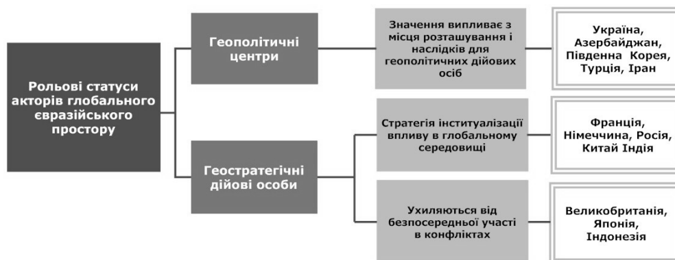
Рис. 4. Рольові статуси акторів глобального євразійського простору

них пріоритетів України. Відповідно, в якості першочергового завдання поставлено завершення переговорів і підписання Договору про створення зони вільної торгівлі між Україною та ЄС. Що стосується розвитку взаємодії з Митним союзом Росії, Казахстану і Білорусі, то позиція України полягає в активізації зусиль у напрямку підтримки розвитку торговельно-економічного, науково-технічного та інвестиційного співробітництва на взаємовигідній основі.