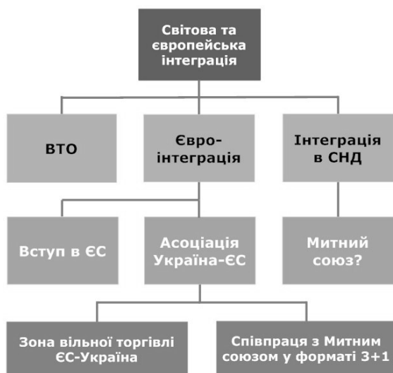
Рис. 3. Інтеграційні інтереси України

Аналітичне вивчення офіційних документів України свідчить про те, що її національні інтереси ставляться правлячими колами з орієнтацією переважно на вирішення внутрішніх проблем при ініціюванні деяких завдань регіонального характеру. Це насамперед побудова громадянського суспільства, досягнення національної згоди і політичної стабільності в суспільстві, перехід до соціально орієнтованої ринкової економіки, розвиток української нації. Така практика оцінюється як "... зануреність національних інтересів у внутрішні проблеми" 1 . Водночас регіоналізм виражається в декларуванні курсу на європейську інтеграцію і прагненні розвивати інтеграційні процеси в рамках СНД (рис. 3). Таке формулювання завдань дуже повільно наближає Україну до Європейського Союзу і не сприяє реальному, повноцінному, ефективному процесу реінтеграції із пострадянського простору. Принаймні Україна не приєдналася до Білорусько-російського союзу та деяких інших структур СНД типу Ташкентського договору, а також не увійшла до Митного союзу Росії, Казахстану і Білорусі.