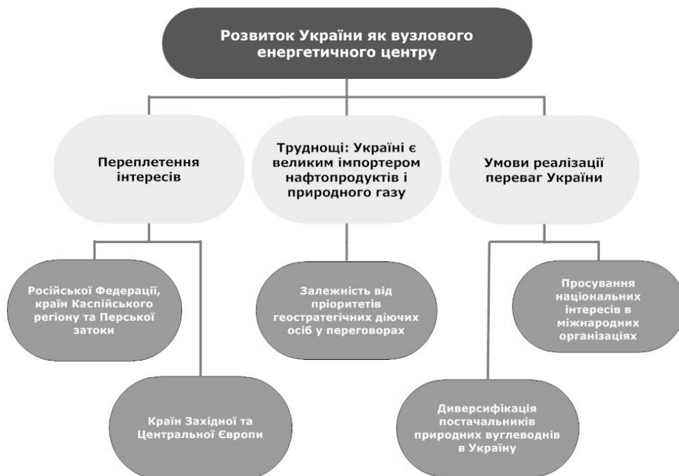
Рис. 5. Розвиток України як вузлового енергетичного центру

Найгостріше в останнє десятиліття перед Україною постала проблема її розвитку як вузлового енергетичного центру, що забезпечує доставку нафти і природного газу на ринки Європи (рис. 5). За таких умов в Україні об'єктивно поєднані інтереси Росії і країн Каспійського регіону і Перської затоки, що володіють основними запасами нафти і газу, з одного боку, та країн Західної та Центральної Європи як великих і постійно зростаючих споживачів природних вуглеводнів. Ситуація ускладнюється тією обставиною, що сама Україна є великим імпортером нафтопродуктів і природного газу. Відповідно як у питанні переходу на діючі в Європі ринкові ціни на послуги трубопровідного транспорту, так і в переговорах, пов'язаних із встановленням цін на імпорт нафтопродуктів і особливо природного газу, представники України найчастіше потрапляють у залежність від пріоритетів геостратегічних діючих осіб, що виражається переважно у формі політичного тиску.