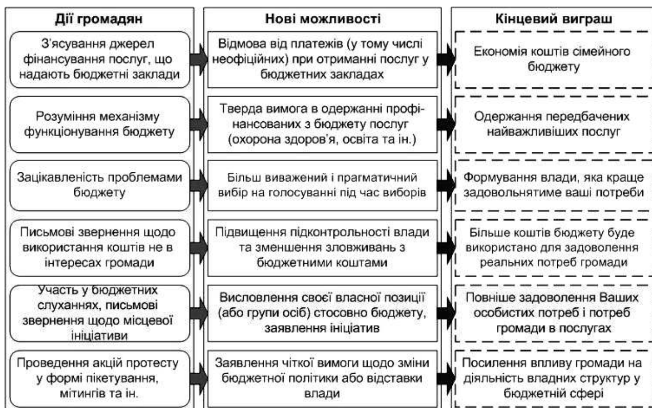
Рис. 3. Очікувані особисті вигоди індивідів від участі у бюджетному процесі

Слід зазначити, що висловити свою позицію щодо бюджету громадяни можуть на громадських слуханнях з питань бюджету, які проводять органи влади. Результати таких слухань повинні бути враховані в роботі органів місцевого самоврядування. Врешті, свою незгоду із бюджетною політикою органів влади населення може висловлювати на організованих акціях протесту. Вимоги громадськості можуть передбачати також дострокове припинення повноваження органів та посадових осіб місцевого самоврядування та ін.