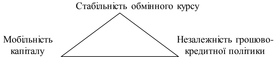
Рис.3. Схема “несумісного трикутника”.

У розділі наведено аргументи щодо необхідності лібералізації валютного регулювання з метою поживлення ділової активності та інтеграції України до світових фінансових та товарних ринків. Аналіз позитивних та негативних сторін лібералізації валютного регулювання дозволяє дійти висновку, що за умови цілковитої лібералізації регулювання валютних відносин державі не вдасться одночасно підтримати бажаний рівень курсу національної валюти, автономність грошово-кредитної політики та мобільність капіталу (рис. 3).