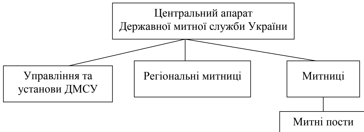
Рис. 1. Система митних органів України

З 01.05.2008 р. в Україні функціонує 3 регіональних митниці та 44 митниці. До регіональних митниць віднесено: Регіональну інформаційну митницю, Енергетичну регіональну митницю та Київську регіональну митницю [2].