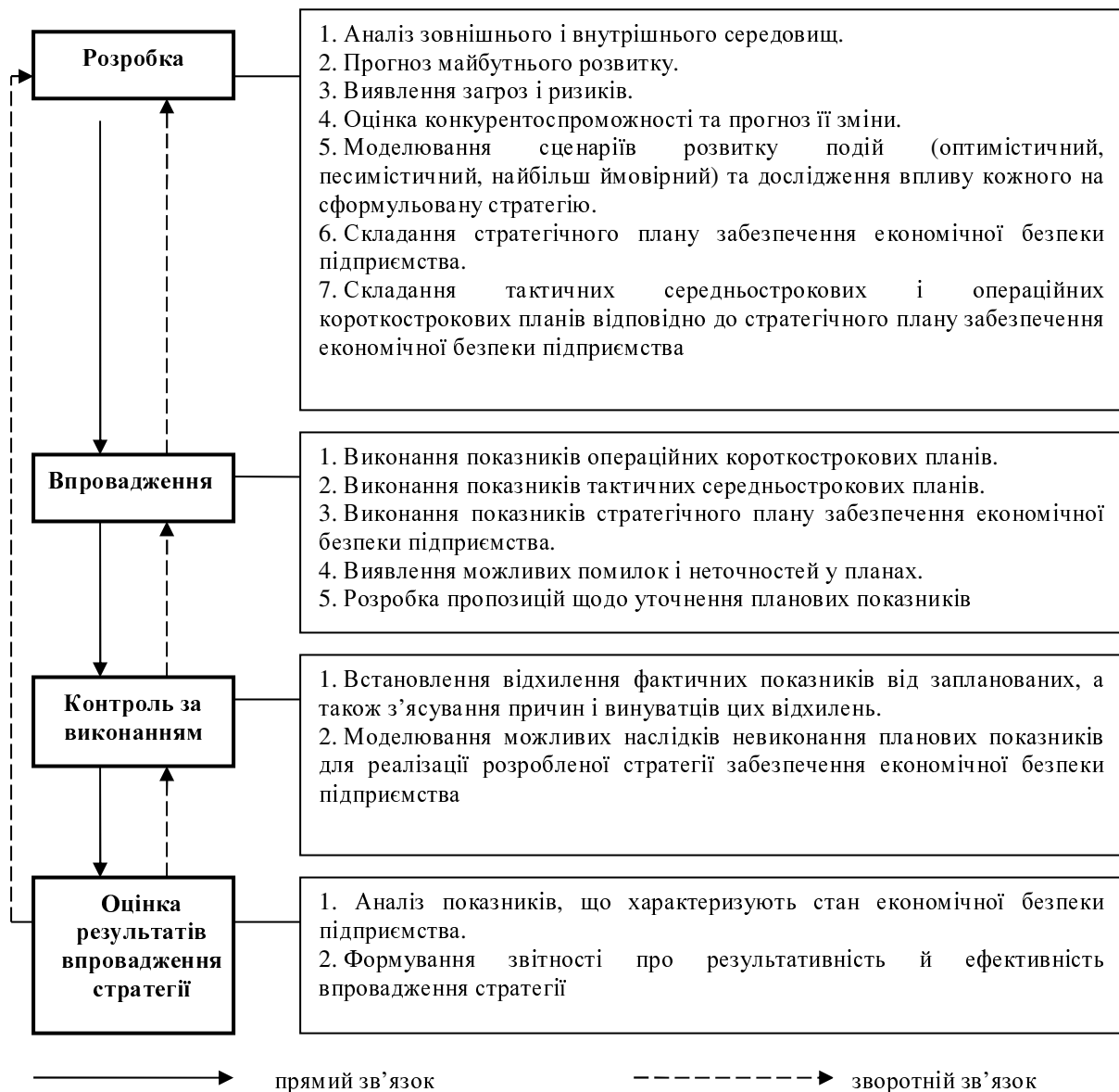
Рис. 2. Модель формування й імplementації стратегії забезпечення економічної безпеки підприємства (розробка автора)

формуванні й імplementації стратегії забезпечення економічної безпеки підприємства варто виділити кілька етапів, а саме: розробку, впровадження, контроль за виконанням та оцінку її результатів (рис. 2).