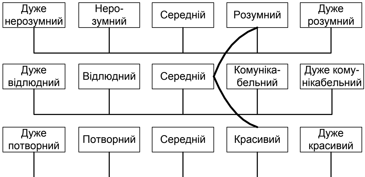
Рис. 3.1. Шкала самооцінки (за В. Янчуком) [93].

Перевагою цього методу є можливість формування загального профілю самооцінки, що дозволяє створити уявлення про особливості структури вимірювань самооцінки. Правда слід зазначити і обмежені можливості співвідношення різних шкал одна з одною, індивідуальні критерії віднесення того або іншого оцінного параметра до відповідного пункту шкали, що можуть сильно відрізнятись.