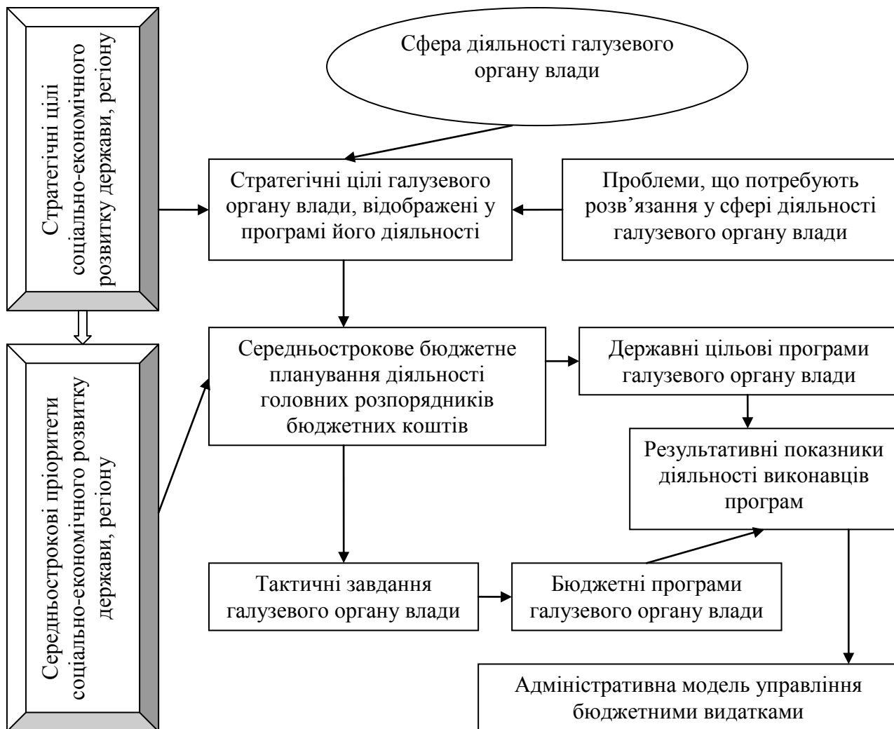
Рис. 2. Концептуальна модель бюджетування відповідно до „проблемно-орієнтованого” підходу*

розподіляють на тактичні завдання, що відображають у бюджетних програмах. Згадана програма містить результативні показники, за допомогою яких фіксують ступінь виконання наміченого тактичного завдання.