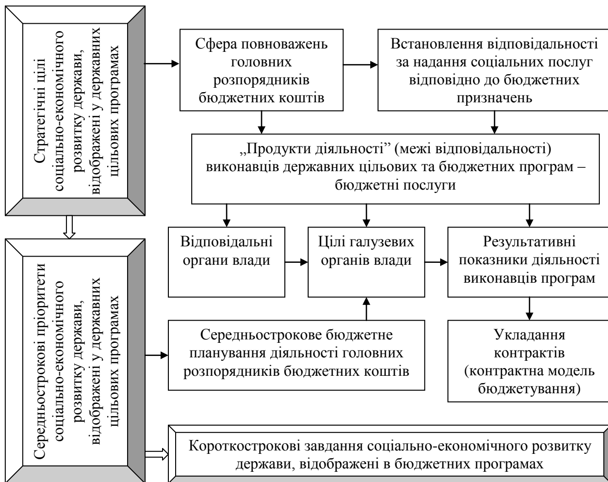
Рис. 1. Концептуальна модель бюджетування відповідно до „сервісного” підходу*

Змістовність першого підходу зображено на рисунку 1, на якому видно, що сфера повноважень головних розпорядників бюджетних коштів є основою для встановлення відповідальності за надання соціальних послуг. Вона визначається нормативно-правовою базою, що розмежовує функції між органами державної і місцевої влади різних рівнів.