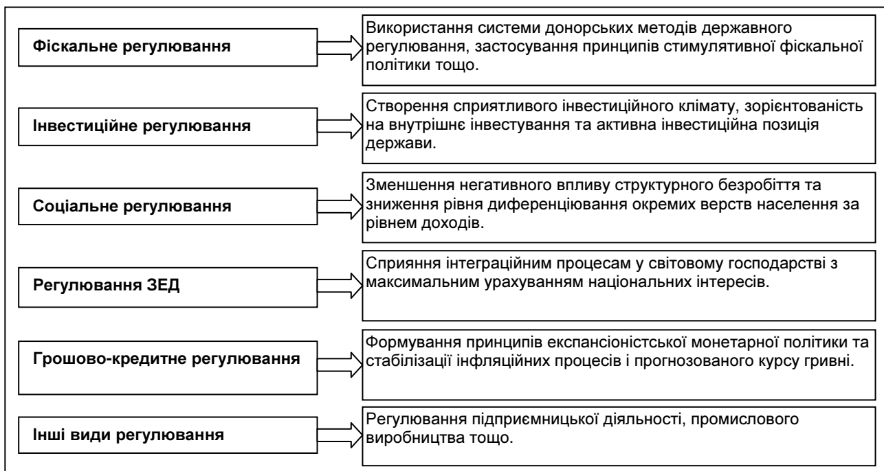
Рис. 2. Інструменти забезпечення економічної стабільності в регіоні

Державна політика в сфері забезпечення фінансово-економічної стабільності в регіоні складається з комплексу управлінських дій у сфері фіскального, грошово-кредитного, інвестиційного, соціального регулювання тощо (рис. 2).