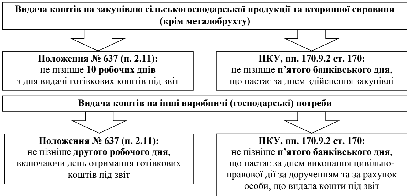
Рис. 1.4. Граничні строки повернення готівкових коштів, виданих у підзвіт

Крім цього, при регулюванні стан розрахунків і дебіторську заборгованість з підзвітними особами ДП „Чортківський КХП” керується нормативними документами, запропонованими в таблиці 1.3.