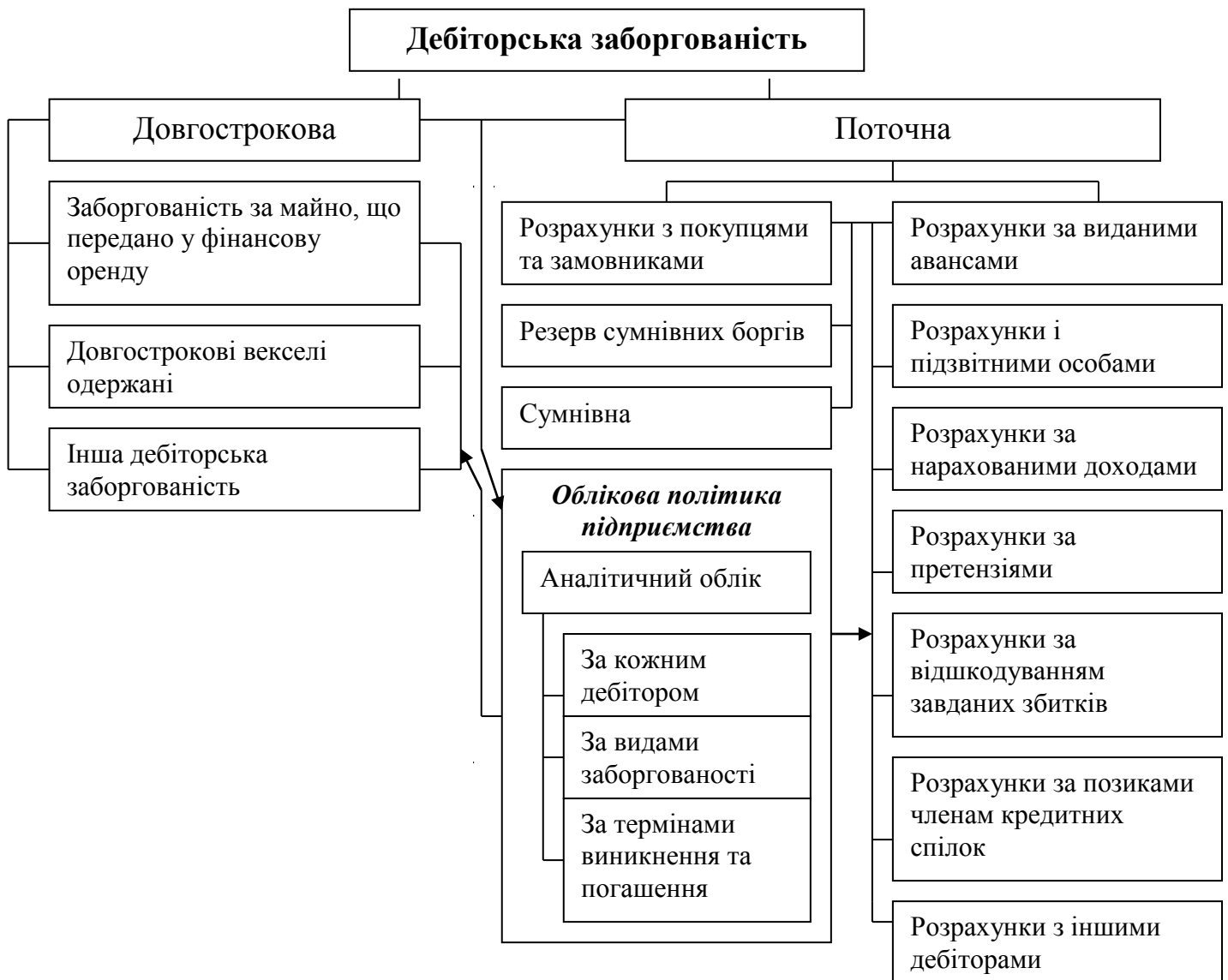
Рис. 1.1. Класифікація дебіторської заборгованості

Після узагальнення економічної літератури щодо дебіторської заборгованості можна подати загальну класифікацію дебіторської заборгованості (рис.1.1.).