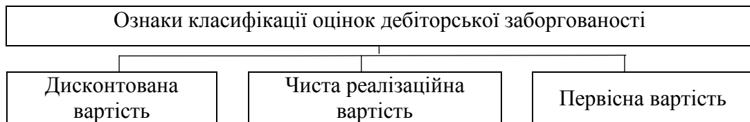
Рис. 1.2. Ознаки класифікації оцінок дебіторської заборгованості

Для обліку сум дебіторської заборгованості застосовується декілька видів оцінок (рис.1.2.).