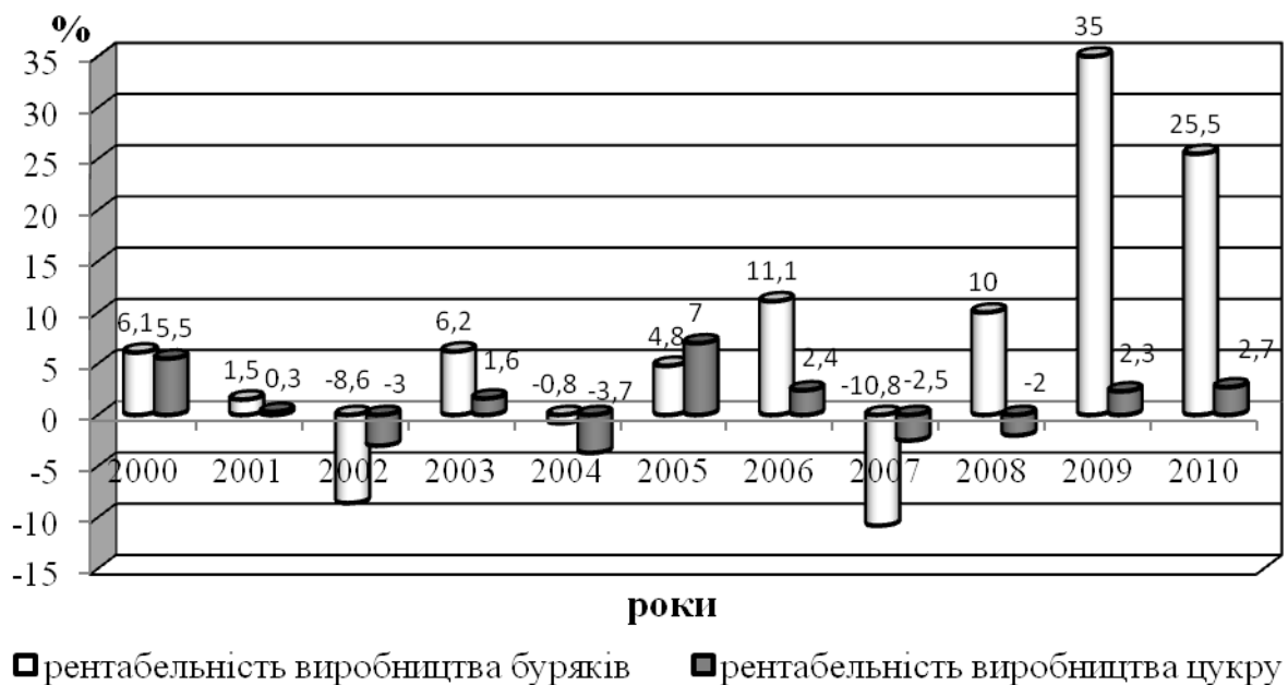
Рис. 1. Рентабельність виробництва цукрових буряків та цукру в середньому по Україні [1, с.102]

Як свідчать дані Національної асоціації цукровиків України „Укрцукор” за останнє десятиліття дохідність цукрової галузі коливається то у сторону збільшення, то у сторону зменшення. За 2008-2010рр. показник рентабельності виробництва цукру поволі почав зростати від -2% у 2008 р. до 2,7% у 2010р. Проте залишається лише у планах досягнення його рівня хоча б 2005 року у 7%.