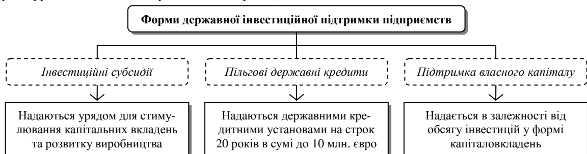
Рис. 1. Форми державної інвестиційної підтримки підприємств у Німеччині*

Зазначимо, що серед європейських країн Німеччина зберегла найдавніші традиції державного стимулювання реального сектора економіки. Незалежно від того, чи є потенційні інвестори резидентами цієї держави, вони можуть скористатися численними преференціями уряду, за яких бюджетні кошти надаються федеральними землями у найрізноманітніших формах: від оплати робочої сили до фінансування наукових досліджень [1, с. 62]. Причому державні інвестиційні субсидії безповоротного характеру – основа комплексу цих заходів (рис. 1).