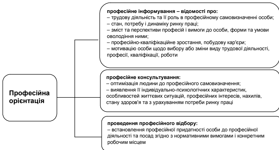
Рис. 1. Професійна орієнтація та її змістові елементи

Закон України «Про зайнятість населення» визначає шляхи, за допомогою яких здійснюється професійна орієнтація: професійне інформування, професійне консультування та проведення професійного відбору (рис. 1).