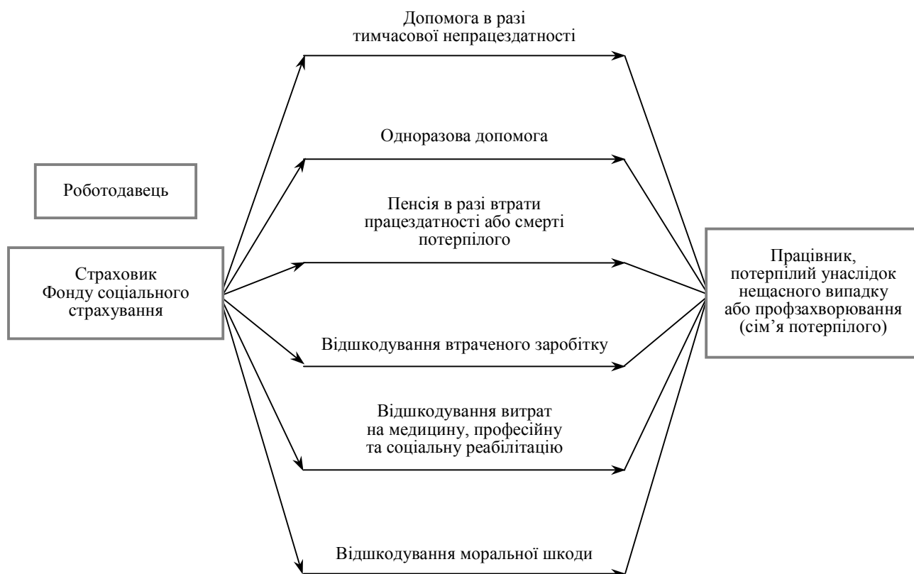
Рис. 4.3. Страхові виплати