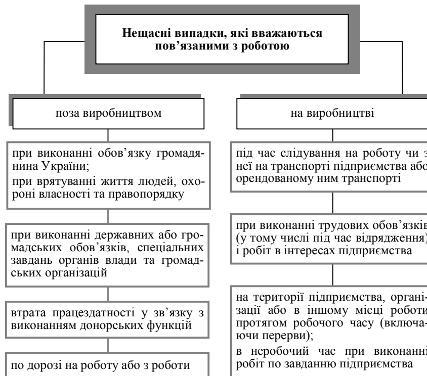
Рис. 4.1. Класифікація нещасних випадків

21 серпня 2001 р. Кабінет Міністрів України прийняв постанову № 1094 «Деякі питання розслідування та обліку нещасних випадків, професійних захворювань і аварій на виробництві», якою затвердив «Положення про порядок розслідування та ведення обліку нещасних випадків, професійних захворювань і аварій на виробництві» (нова редакція) й Перелік обставин, за яких настає страховий випадок державного соціального страхування громадян від нещасного випадку на виробництві та професійного захворювання.