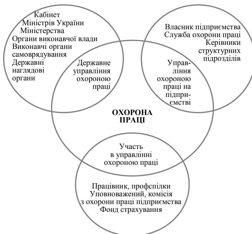
Рис. 1. Система управління охороною праці в ринкових умовах

– кожний працівник повинен дбати про здоровий стиль життя і праці, постійно підвищувати свій кваліфікаційний, фізичний та психофізіологічний стан, програмувати шлях здорового довголіття, запобігання випадків травматизму і захворювань. Він повинен негайно повідомити свого керівника про виникнення будь-якої небезпечної ситуації. Керівник не може вимагати від працівника виконання роботи до усунення небезпечної ситуації (пошкодження огорожі, блокування, сигналізації, запиленості, загазованості тощо). Комплексне управління охороною праці з боку держави, власника і працівника забезпечить підвищення ефективності цієї діяльності.