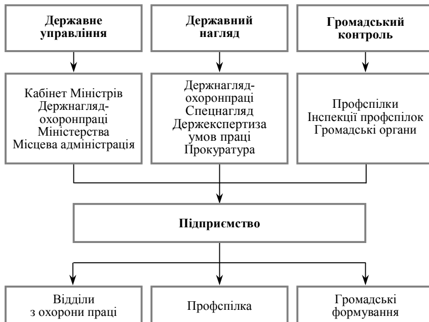
Рис. 2. Органи, які здійснюють управління, нагляд і контроль за станом умов праці та охорони праці

Державне управління охороною праці (рис. 2) здійснюється шляхом сукупності скоординованих дій органів державного управління охороною праці, органів місцевого самоврядування за участю об'єднань роботодавців, професійних спілок та інших представницьких органів з реалізації основних напрямів соціальної політики в галузі охорони праці, спрямованих на забезпечення безпечних і здорових умов праці.