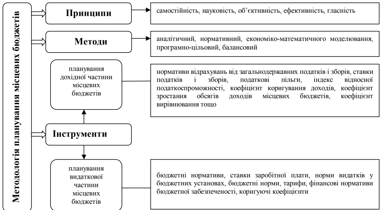
Рис. 1. Складові методології планування місцевих бюджетів

У процесі дослідження встановлено, що планування місцевих бюджетів має базуватися на основі визначеної методології (рис. 1).