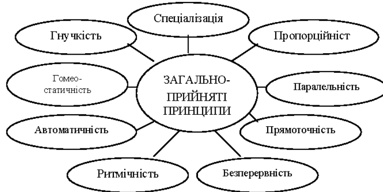
Рис. 2. Пропонована схема загальноприйнятих принципів у дослідженні економічних відносин

Наступним головним завданням у дослідженні економічних відносин у переробних підприємствах АПК є аналіз організаційно-економічних відносин, що відображають створення найкращих умов для скорочення усіх матеріальних потоків – від отримання сировини до випуску готової продукції – та забезпечення безперервного обслуговування виробництва як засобу нарощування продуктивності і поліпшення використання виробничих потужностей підприємства. Щоб виконувались ці завдання, організація виробничих процесів повинна відповідати певним загальноприйнятим принципам, які рекомендовані мною у рисунку 2.