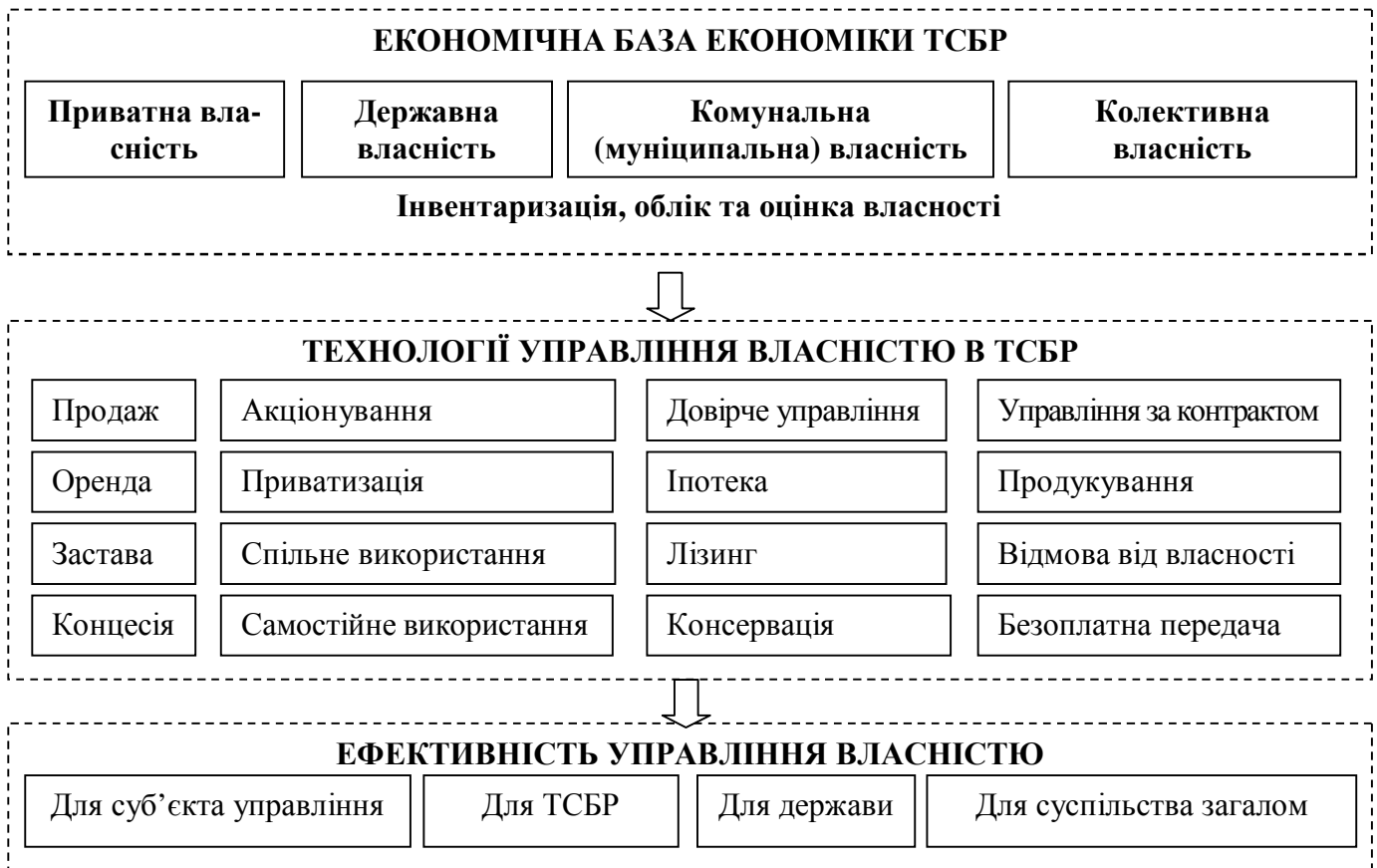
Рис. 3. Управлінські технології в системі управління власністю в ТСБР

визначено концептуальні засади формування місцевої економічної політики та збалансування інтересів суб'єктів управління економічним розвитком ТСБР.