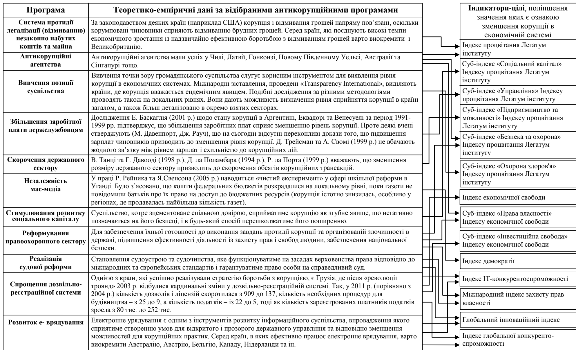
Рис. 3. Антикорупційні програми та індикатори-цілі антикорупційної політики