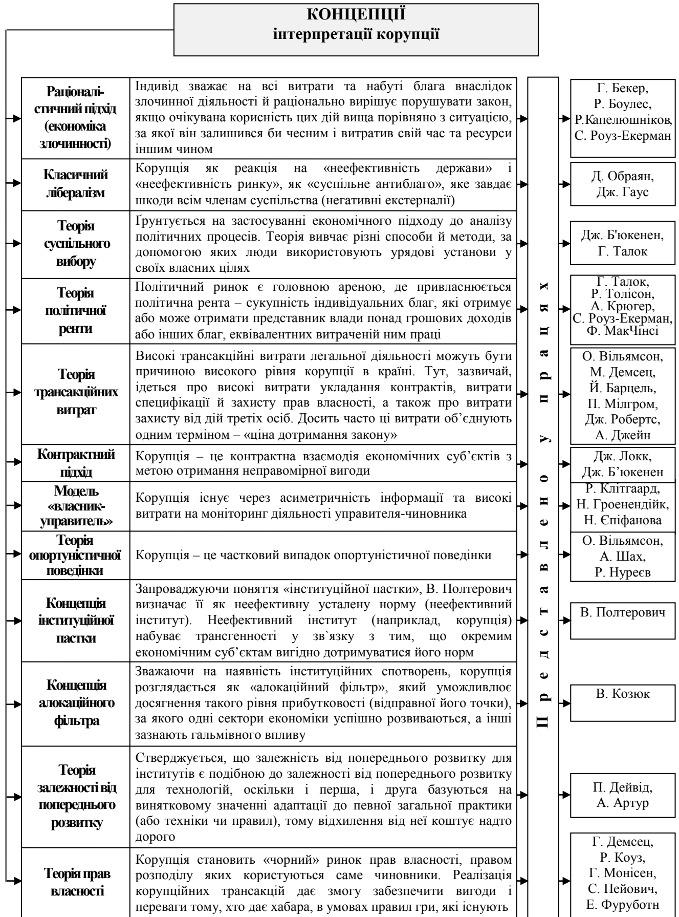
Рис. 1. Концептуальні теоретико-методологічні підходи інтерпретації феномена корупції в площині інституціоналізму