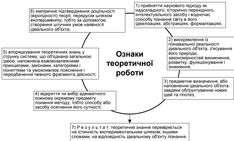
Рис. 1. Ознаки теоретичної роботи у системі професійного методологування [13, с. 31]

саме ідеально сконструйований об'єкт. “Звідси теоретик, на відміну від методолога, здобуває знання про світ ідеального, або про світ ідеальних сутностей, котрий прихований за світом реальності-видимості” [13, с. 31]. Одним із авторів ще у 2005 році виокремлені ознаки теоретичної роботи на відміну як від методологічної, так і науково-практичної та експериментальної [див. там само, с. 30-34] (рис. 1).