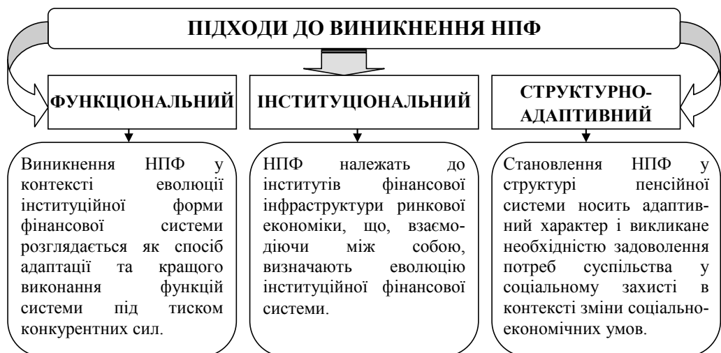
Рис. 2. Підходи до виникнення НПФ*

Висновки. У процесі розгляду переваг та недоліків розподільчої і накопичувальної пенсійних систем з’ясовано, що повністю розподілити ризики пенсійної системи та забезпечити її відповідність ключовим критеріям ефективності можливо лише шляхом комбінації розподільчих і накопичувальних елементів. При цьому з підвищенням ролі