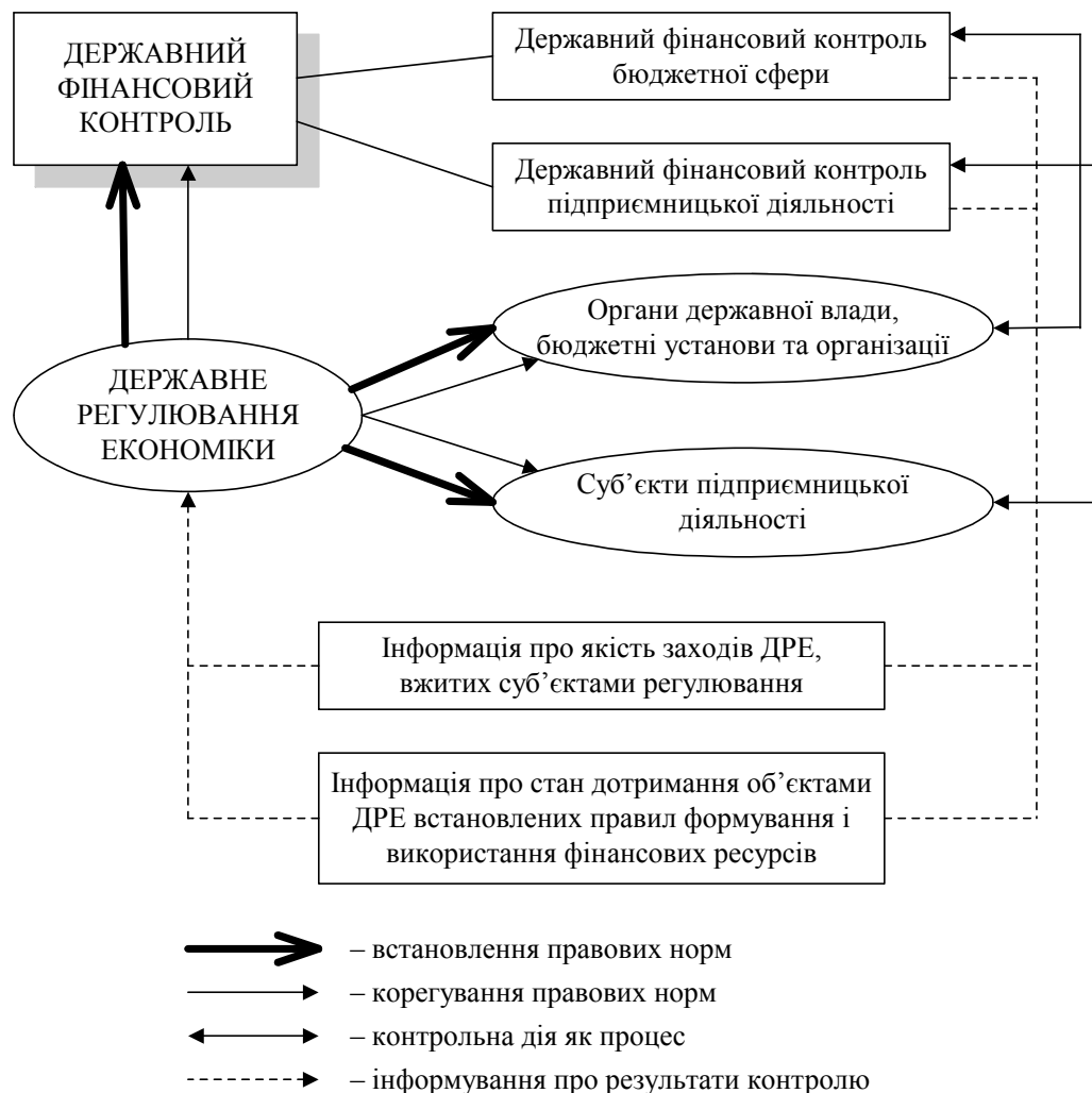
Рис 1.1. Місце державного фінансового контролю в системі державного регулювання економіки