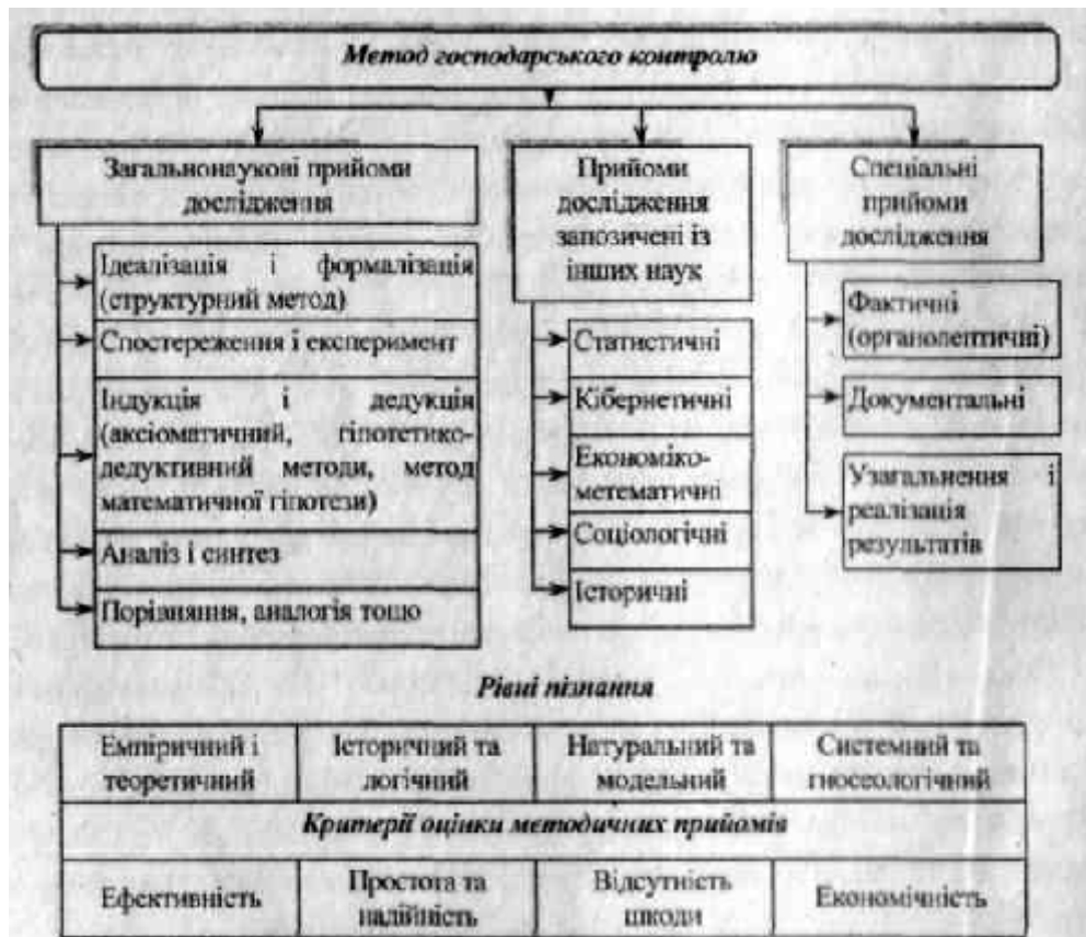
Рис2. Методи господарського контролю

Методичні прийоми здійснення контролю застосовуються лише в межах і випадках, які спеціально регламентовані чинним законодавством, а методичні прийоми пізнання істини законом не передбачені. Регламентується лише порядок і техніка їх застосування на практиці, тобто під час вивчення об'єктивної істини.