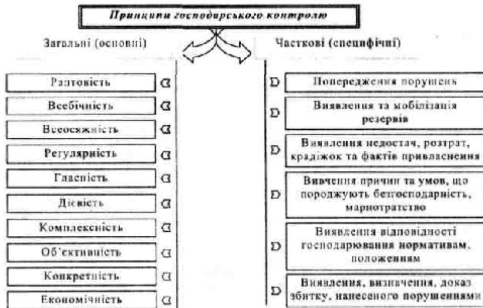
Рис. 1.1. Принципи господарського контролю

Систему принципів господарського контролю поділяють на дві групи: загальні (основні) і часткові (специфічні) (див. рис.1.1 ).