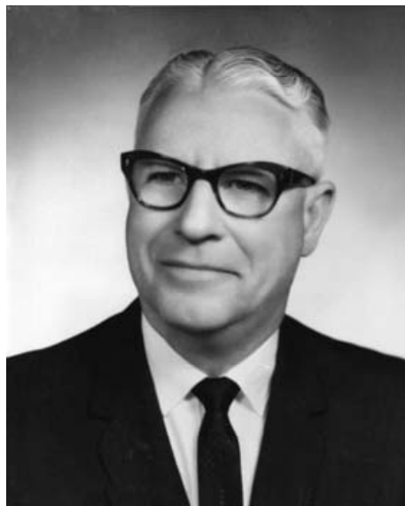
ФІЛІП ЛЕРШ (1898–1972)

Наукове значення цього тексту полягає в тому, що тут подається і конкретизується незвичний (принаймні, для свого часу) підхід до періодизації психічного розвитку дитини і підлітка.