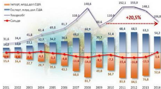
Рис. 2 Динаміка обсягу експортних операцій України в 2001-2014 роках [2].

Експорт товарів з України за підсумками 2014 року становить 54,2 млрд. грн, що менше попереднього 2013 року на 14%. Якщо розглядати динаміку за роками (рис. 2), то експорт 2014 зменшився лише порівняно з 2008 та 2011-2013 роками.