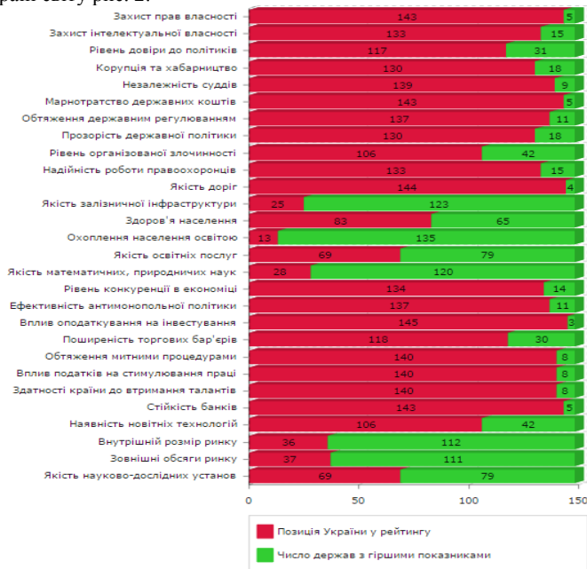
Рис. 2. Рейтинг України з 148 країн світу, за окремими складовими ІК у 2013-2014 рр.

Настільки низькі показники є результатом надмірної забюрократизованості та корумпованості соціально-економічної системи держави. Наведені нижче результати дають нам змогу сформуванати цілісну картину про рівень розвитку в найбільш важливих сферах життя суспільства та стану економіки, вплив факторів на розвиток цілих галузей та місце України серед країн світу рис. 2.