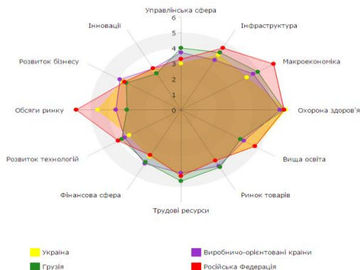
Рис. 4. Порівняння показників складових індексу конкурентоспроможності у 2013-2014 роках

Проведений нами як історичний, так і причинно-наслідковий аналіз конкурентоспроможності дозволив визначити, що економіка України володіє потенціалом щодо посилення позицій, проте все таки існує ще багато бар'єрів, які необхідно подолати на шляху до підвищення рівня конкурентних переваг на світовому ринку. Згідно із дослідженнями Всесвітнього економічного форуму, найбільшими перешкодами для України у питаннях ведення бізнесу є корупція, недосконале податкове законодавство, бюрократія, інфляція, політична нестабільність тощо. І саме боротьба з цими явищами повинна стати основним пріоритетом суспільно-політичних відносин в нашій країні.