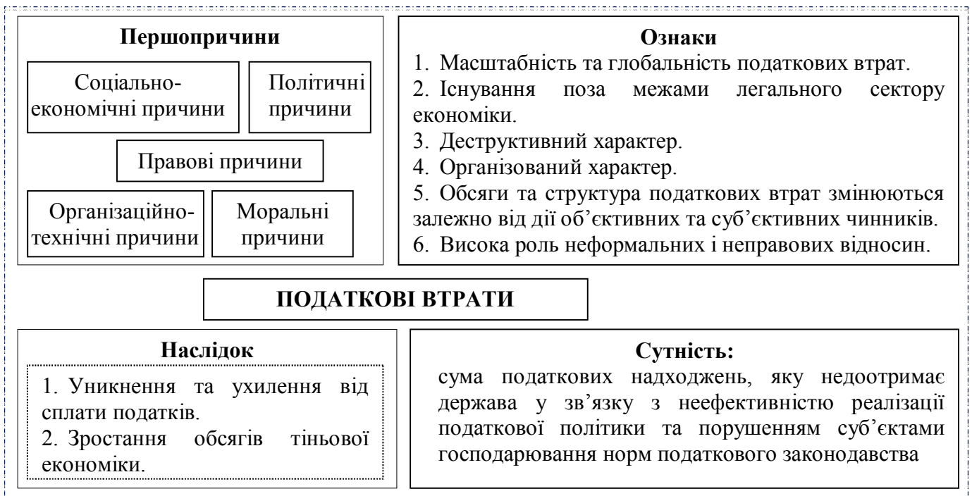
Рис. 1. Комплексна характеристика податкових втрат

З'ясування причинно-наслідкової моделі виникнення податкових втрат дало змогу виділити ознаки, які їх характеризують, систематизувати їхні риси, властивості та особливості. На цій основі сформовано комплексну характеристику податкових втрат (рис. 1).