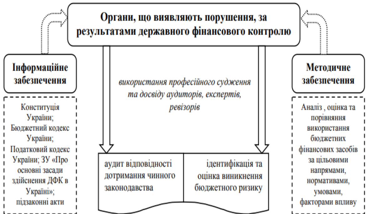
Рисунок 2.1. Система елементів державного фінансового контролю

є: нормативно-правова база, органи, що здійснюють державний фінансовий контроль, та органи, що застосовують окремі форми та методи контролю (рис. 2.1).