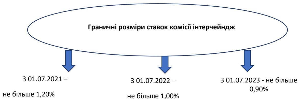
Рис. 2. Зниження граничних розмірів ставок комісії інтерчейндж [12]

Зокрема, У Проєкті Закону України пропонується внести зміни до Закону України «Про платіжні системи та переказ коштів в Україні», Закону України «Про банки і банківську діяльність», а також до Закону України «Про платіжні послуги», який було прийнято Верховною Радою України 30 червня 2021 року, і через рік після набрання ним чинності буде введено в дію замість Закону України «Про платіжні системи та переказ коштів в Україні».