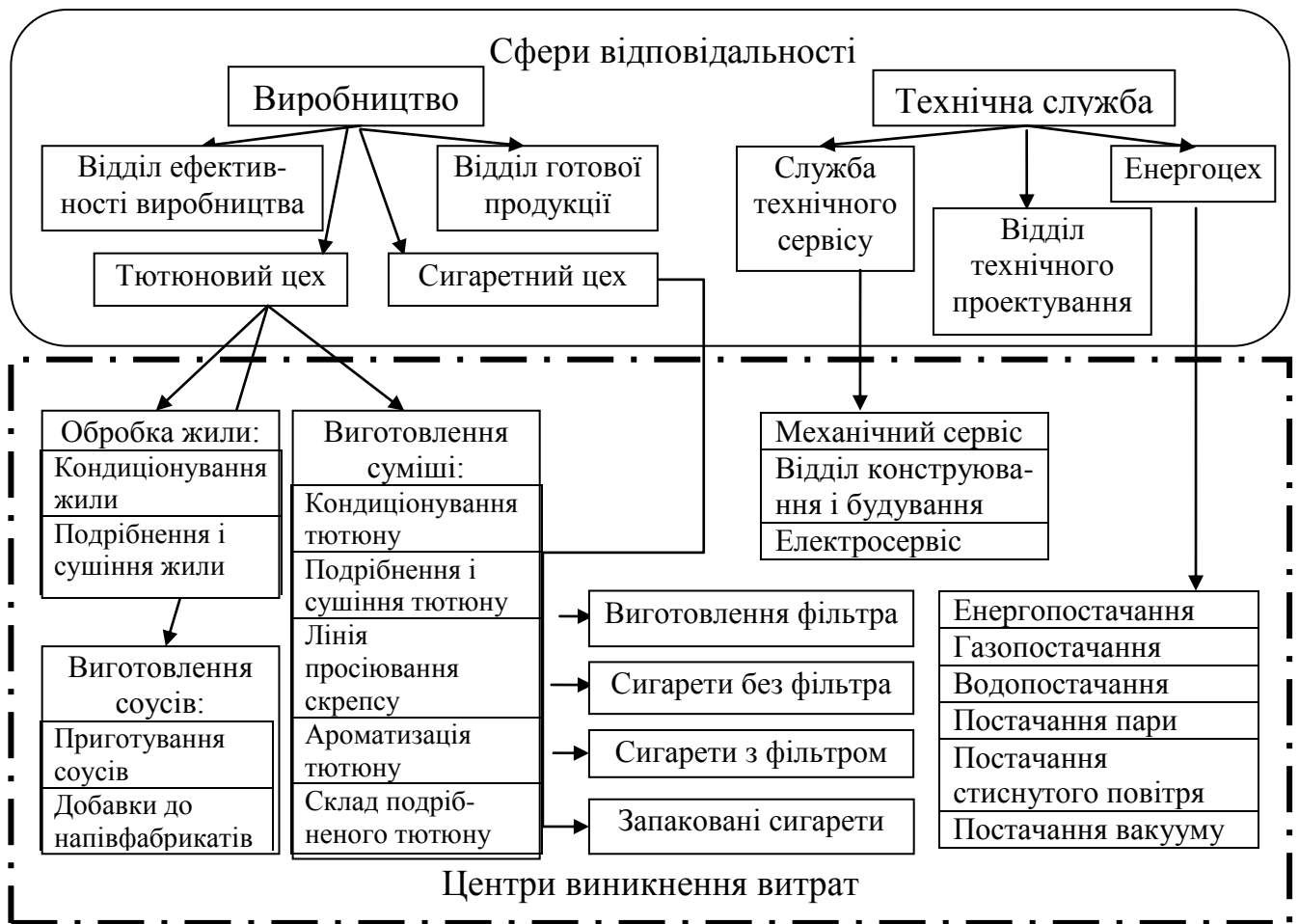
Рис. 1. Структура центрів виникнення витрат і сфер відповідальності

На основі аналізу та узагальнення поглядів вітчизняних і зарубіжних вчених щодо обліково-аналітичного забезпечення удосконалено тлумачення його сутності. Доведено, що несформованість єдиного підходу до розгляду цього поняття як цілісної інтегрованої системи унеможливорює формування необхідної диференційованої інформації для менеджерів тютюнових підприємств відповідних рівнів при прийнятті оперативних рішень. Наголошено на важливості об'єднання планування, обліку, аналізу та контролю в цілісну систему обліково-аналітичного забезпечення діяльності підприємств з урахуванням наявності множинних і достатньо потужних інформаційних зв'язків між підсистемами й елементами системи, неперервності, динамічності характеру розвитку та впливу зовнішнього середовища.