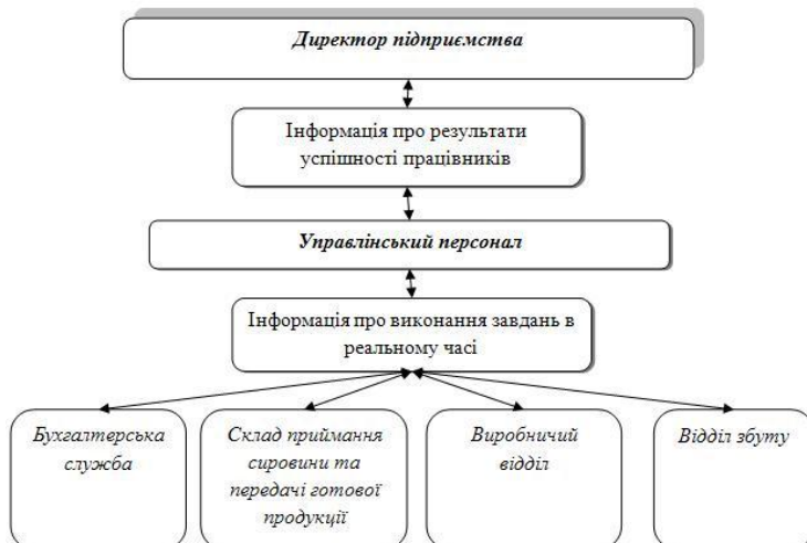
Рис. 2. Схема дії автоматизованої програми усіх підрозділів підприємства

На сьогоднішній день, існуючі автоматизовані програми, які застосовуються в обліковому процесі не дозволяють автоматизувати всю роботу підприємства, і саме тому для полегшення управління підприємством слід створити програму, яка б дала змогу отримувати та надавати інформацію з різних підрозділів саме управлінському персоналу в часі (online) (рис. 2).