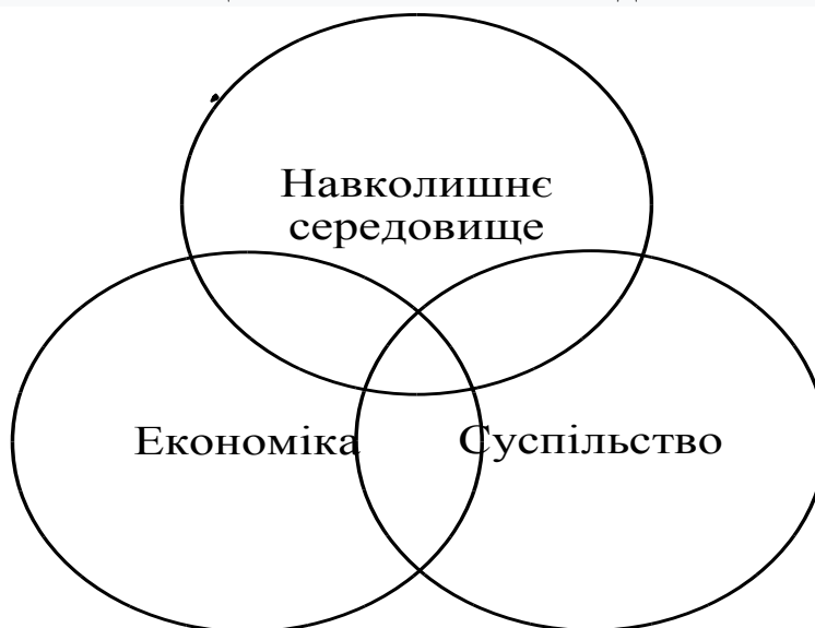
Рис. 1. Зона формування соціальної цінності

Попри значний розвиток теоретичних, методологічних, організаційних та методичних положень аудиту, варто відмітити, що в сучасній економічній науці поки що відсутнє цілісне уявлення про інформаційне забезпечення соціального аудиту та його місце в системі соціально-економічних відносин.