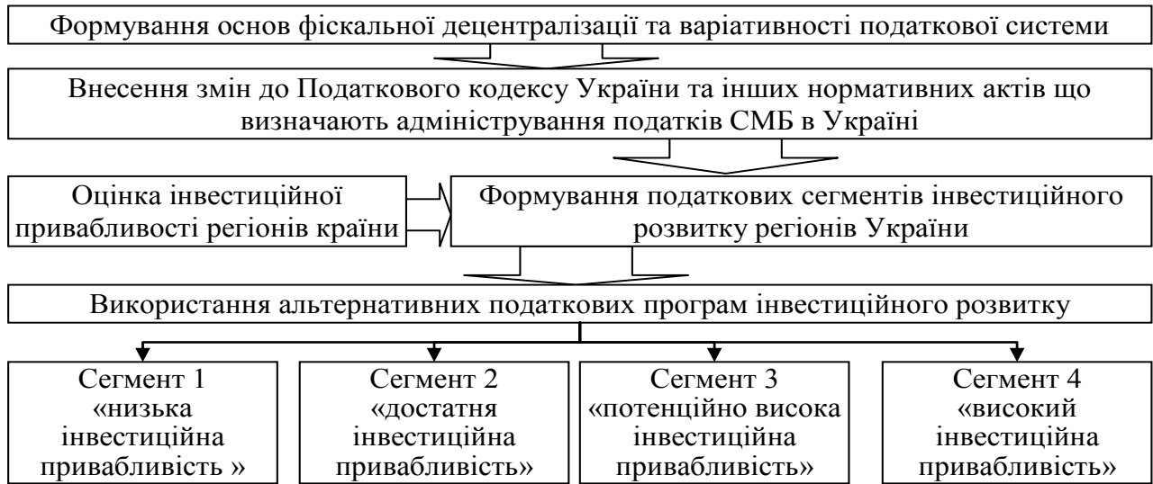
Рис. 3. Методичний підхід до податкового регулювання інвестиційного розвитку малого та середнього бізнесу в Україні

В результаті досліджень встановлено, що вибір альтернативної сукупності податкових важелів інвестиційного розвитку суб'єктів МСБ доцільно здійснювати з урахуванням інвестиційного потенціалу окремих регіонів України (рис. 3).