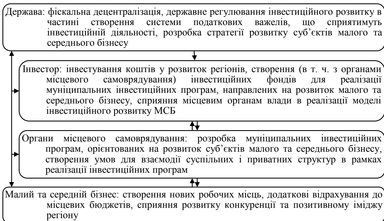
Рис. 1. Система взаємозв'язку податкової політики та процесів інвестиційного розвитку суб'єктів малого та середнього бізнесу

бізнес. За цим принципом в роботі розроблено систему взаємозв'язку податкової політики держави та процесів інвестиційного розвитку суб'єктів МСБ (рис. 1).