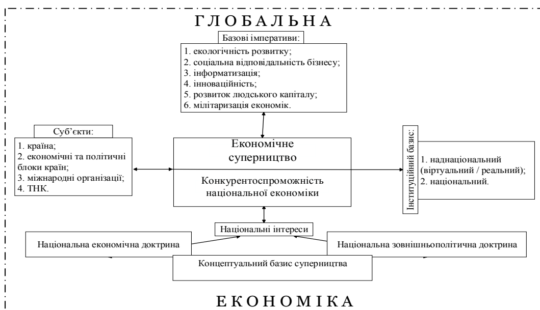
Рис. 1. Теоретична модель економічного суперництва країн у глобальній економіці