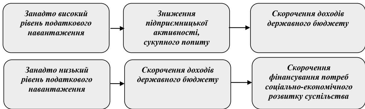
Рис. 2. Вплив рівня податкового навантаження на соціально-економічні процеси в державі

Примітка: побудовано автором за даними [3]