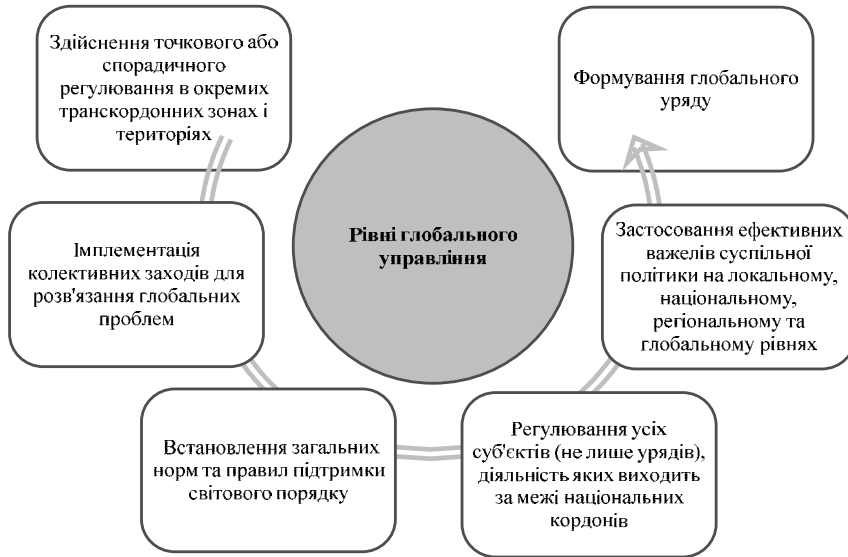
Рис. 3. Рівні глобального управління