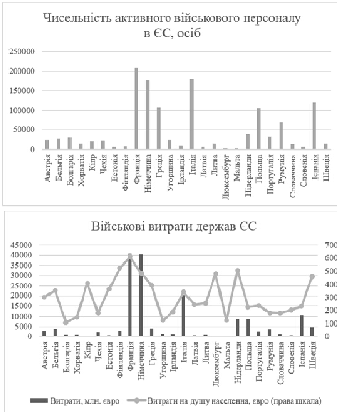
Рис. 2. Структура військових витрат та військового контингенту в ЄС, 2018 р.

Проте, як підсумовує у своєму спеціалізованому дослідженні О. Коломієць, аналіз участі ОБСЄ у врегулюванні локальних конфліктів і новітніх викликів безпеці у постбіполярній Європі не дозволяє вести мову про належну ефективність організації в системі регіональної безпеки. Під час врегулювання криз і конфліктів регулярно проявлялись розбіжності щодо ролі ОБСЄ в системі європейської регіональної безпеки, координації її дій з ООН, НАТО та ЄС. Внаслідок чого організація відігравала вторинні функції післявоєнного врегулювання локальних конфліктів на теренах Грузії, Боснії та Герцеговини, Косово, а тепер і України [12].