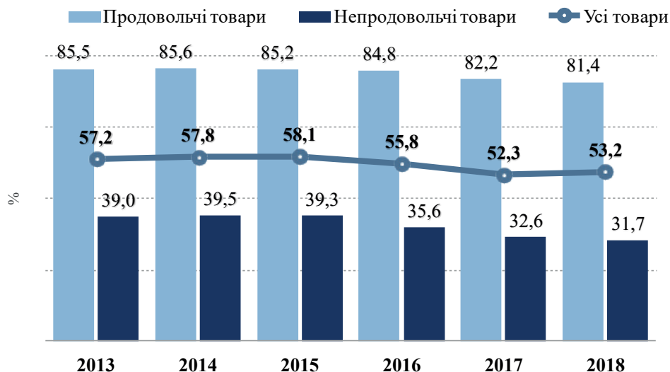
Рис. 2. Динаміка частки продажу споживчих товарів, вироблених в Україні, через торгову мережу підприємств у 2013–2018 рр., %*