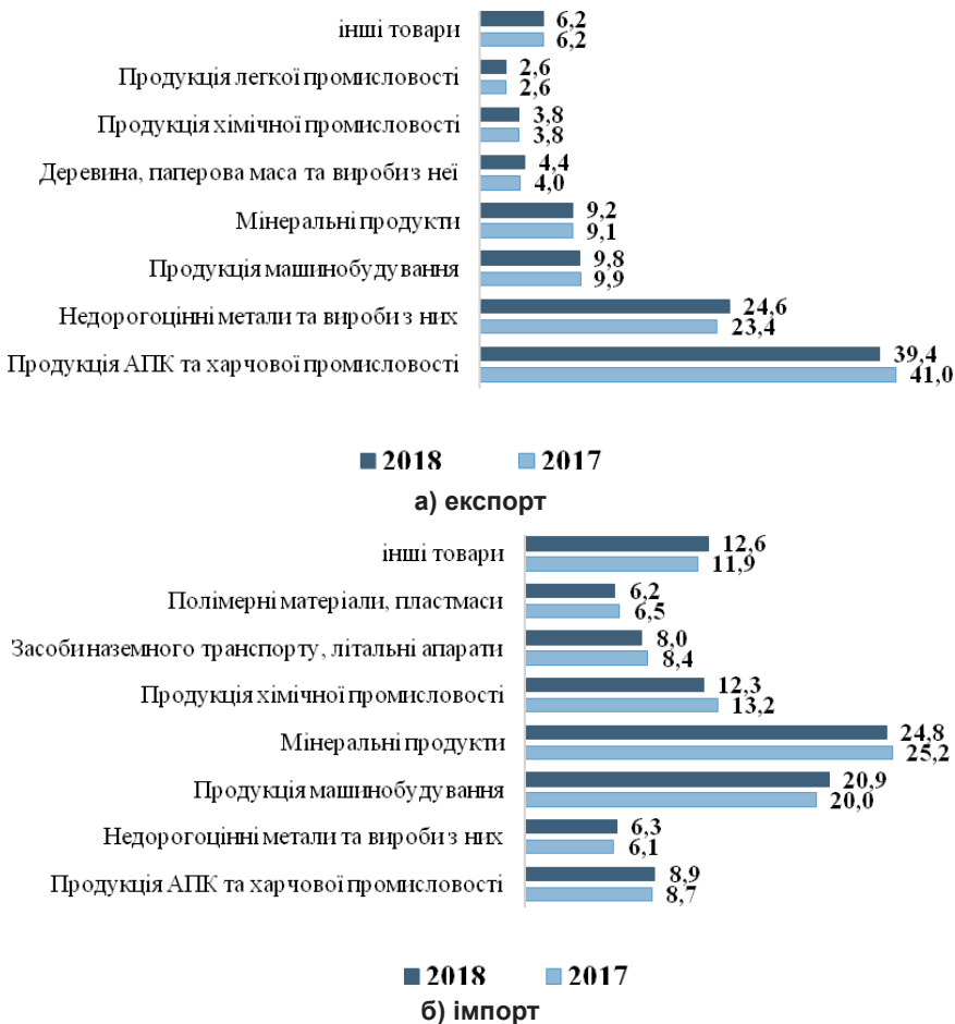
Рис. 4. Товарна структура експорту та імпорту у 2017–2018 рр., %*