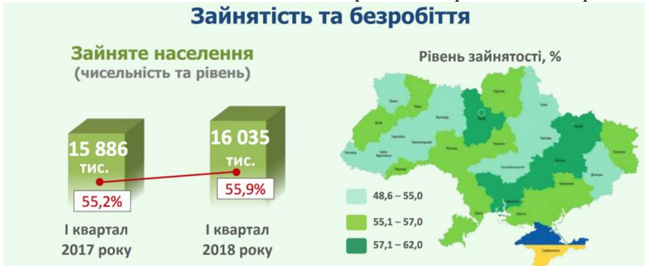
Рис. 1. Зайнятість та безробіття в Україні.

Статистичні дані щодо зайнятості і безробіття в Україні подано на рис. 1.