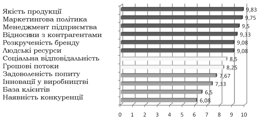
Рис. 2. Пріоритетність факторів формування гудвілу ПАТ «ТерА»