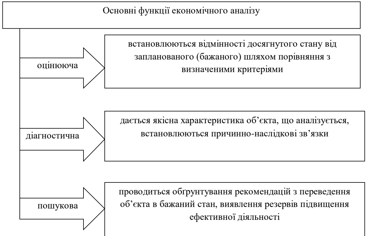
Рис.1. Основні функції економічного аналізу

Три основні функції економічного аналізу – оцінююча, діагностичну і пошукову відображені на рисунку 1 .