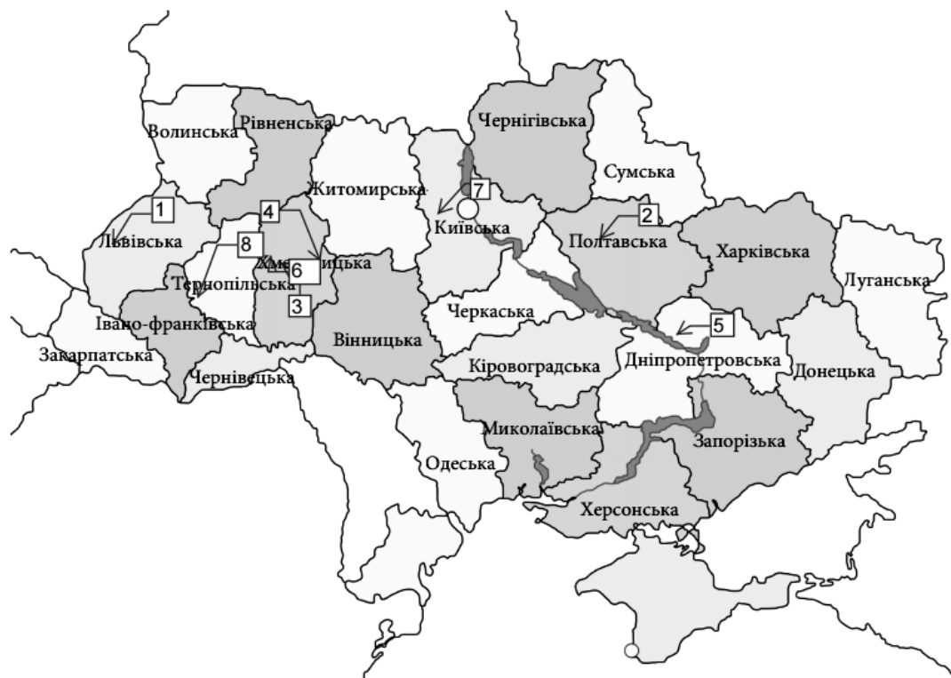
Рис. 3. Регіони-лідери в конкурентному розвитку текстильного виробництва

Регіонами-лідерами, які за результатами проведеного дослідження показали першість, визнано Львівську, Полтавську, Хмельницьку, Житомирську, Дніпропетровську, Київську, Тернопільську області (рис. 3).