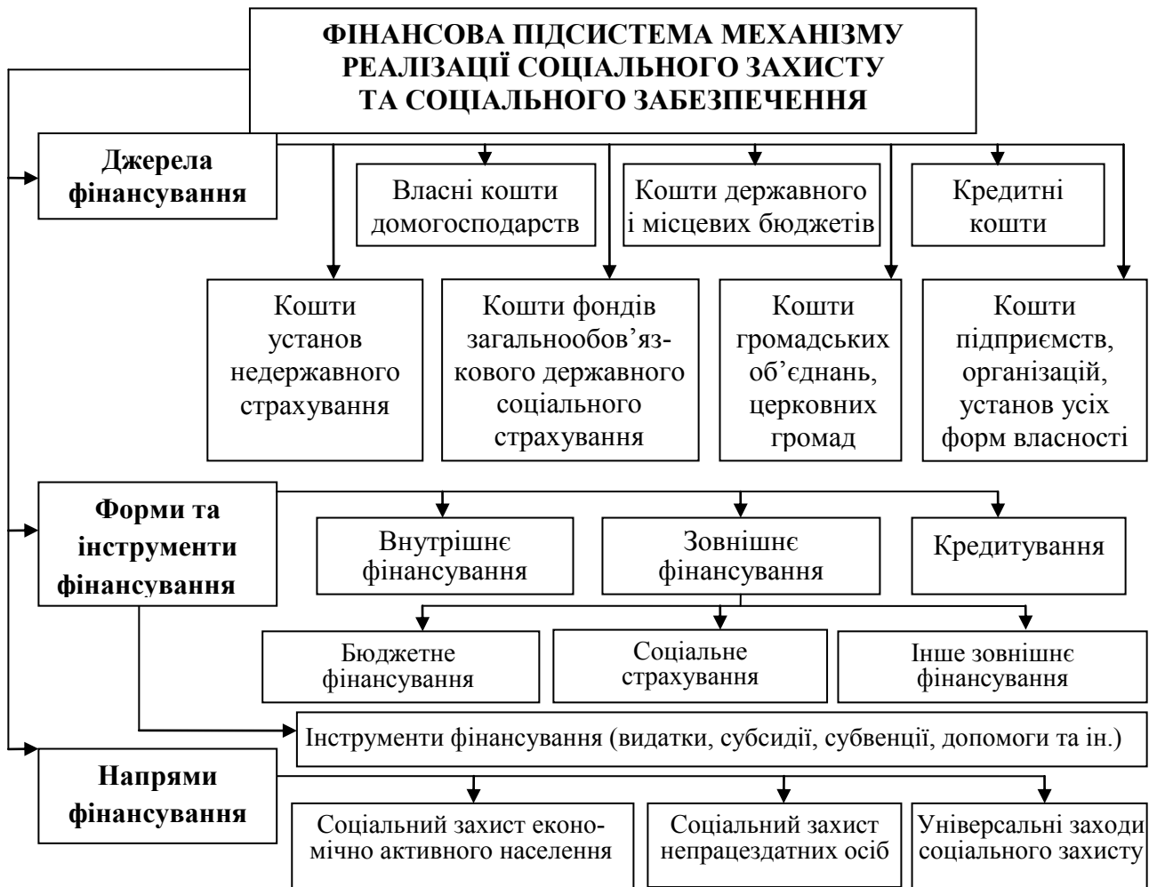
Рис. 1. Структурно-логічна схема фінансової підсистеми механізму реалізації соціального захисту та соціального забезпечення населення

Існуючі теоретичні підходи щодо об'ємно-структурних параметрів видатків бюджету на соціальний захист і соціальне забезпечення, їх впливу на економіку та вектори оптимізації характеризуються значною полярністю. Виявлено превалювання помилкового підходу до трактування оптимізації як процесу звуження масштабів соціальної відповідальності держави і скорочення видатків бюджету на соціальні заходи.