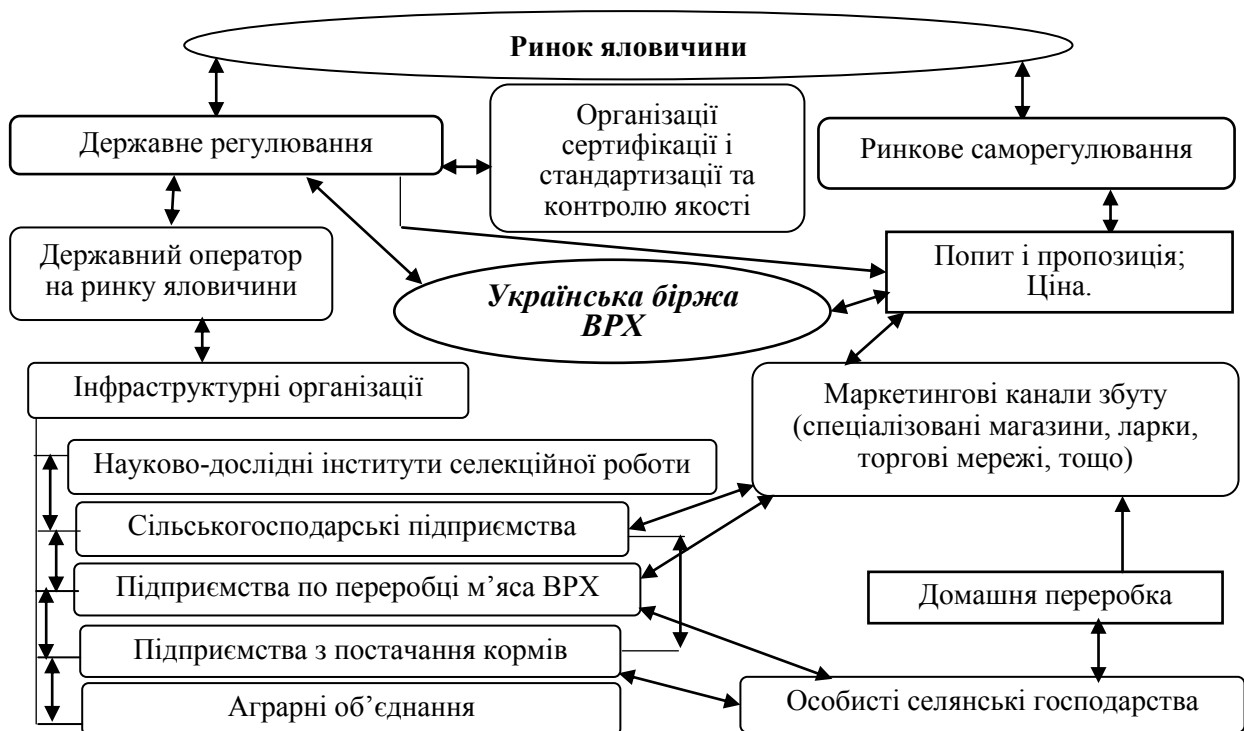
Рис. 4. Схема організаційно-економічних взаємовідносин на ринку яловичини в умовах його інноваційного розвитку

Цілями формування інтеграційних процесів у рамках реалізації інноваційної моделі розвитку є вдосконалення взаємовідносин між учасниками ринку на основі прозорості координації. При цьому економічна діяльність інтеграційних об'єднань на ринку яловичини могла б забезпечувати високу питому вагу валового виробництва продукції. З цією метою рекомендується створення асоціативних осередків відтворювальних та переробних підприємств з центром, що забезпечить найбільший соціально-економічний ефект.