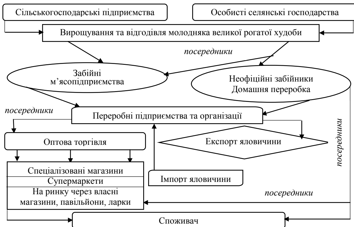
Рис. 2. Формування ланцюга вартості кінцевої товарної продукції на ринку яловичини в Україні

структур різного типу, що призводить до вилучення необхідного продукту на рівні виробництва, зумовлюючи збитковість галузі (-30%). Перманентне перевищення собівартості виробництва живої (забійної) ваги худоби над діючими на ринку реалізаційними цінами зумовлює процес звуженого відтворення, за якого показники обсягу реалізації продукції ВРХ перевищують темпи відгодівлі молодих тварин.